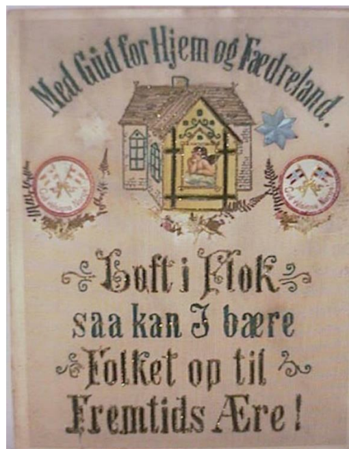
Biletet 1: "Med Gud for Hjem og Fædreland. Løft i Flok saa kan I bære Folket op til Fremtids Ære". Slike bodskapar hang på veggen i mange norske heimar rundt 1905.

Ei grein av nasjonalisme er nasjonsbygging . I ein tidsbolk frå i god tid føre 1814 og i alle fall fram til Gerhardsen-perioden var nasjonsbyggingstida; då nasjonsbyggjarane dreiv på. Øystein Sørensen (1998) skriv om 14 nasjonsbyggingsprosjekt i Noreg, frå denne tidsbolken. Me kan dele prosjekta inn to grupper, dei liberale og dei konservative . Desse stridde om kva nasjon dei skulle byggje, for nasjonsbygging handlar om å byggje ein nasjon, i vid meining. Det galt å byggje ein identitet, eit folk og eit rike. Lykelord er skuleverk, opplysning og ikkje minst fellesskap. Men kva slags fellesskap? Nokre, mellom andre Bjørnstjerne Bjørnson, hevda at me laut sjå framover; ikkje bruke