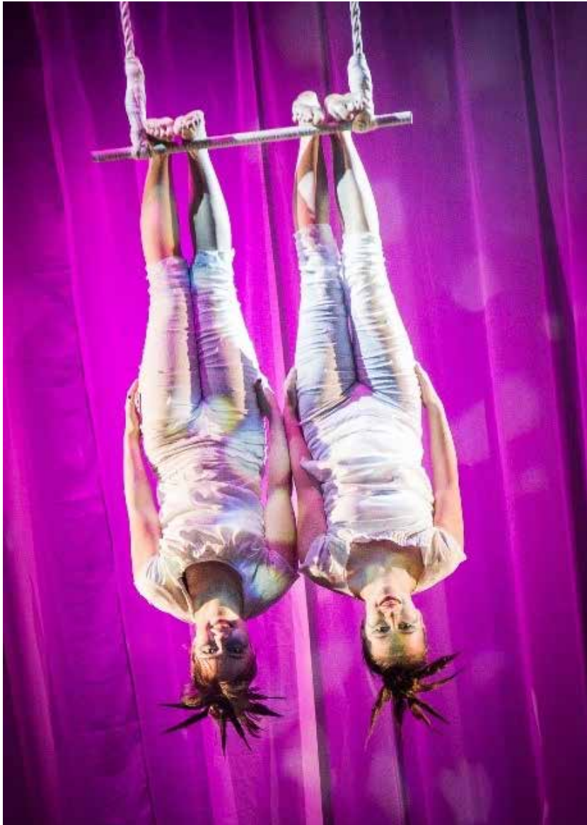
Bilde 2. Trapeskunstnere fra kulturskolen.

Pyramidegruppa trenger mitt nærvær så å si hele tiden /.../ men stort sett er det behov for at jeg passer på flygeren vår (Hun som står på toppen av pyramiden). Jeg sikrer henne enten ved at jeg holder henne i en lonsje (et tau som er festet rundt livet hennes) eller ved at jeg står på bakken, bak henne, klar til å ta imot om hun faller. Foran kan det ligge en madrass, eller hun har ansvar for å lande kontrollert selv (Leas logg 18.10. 2016).