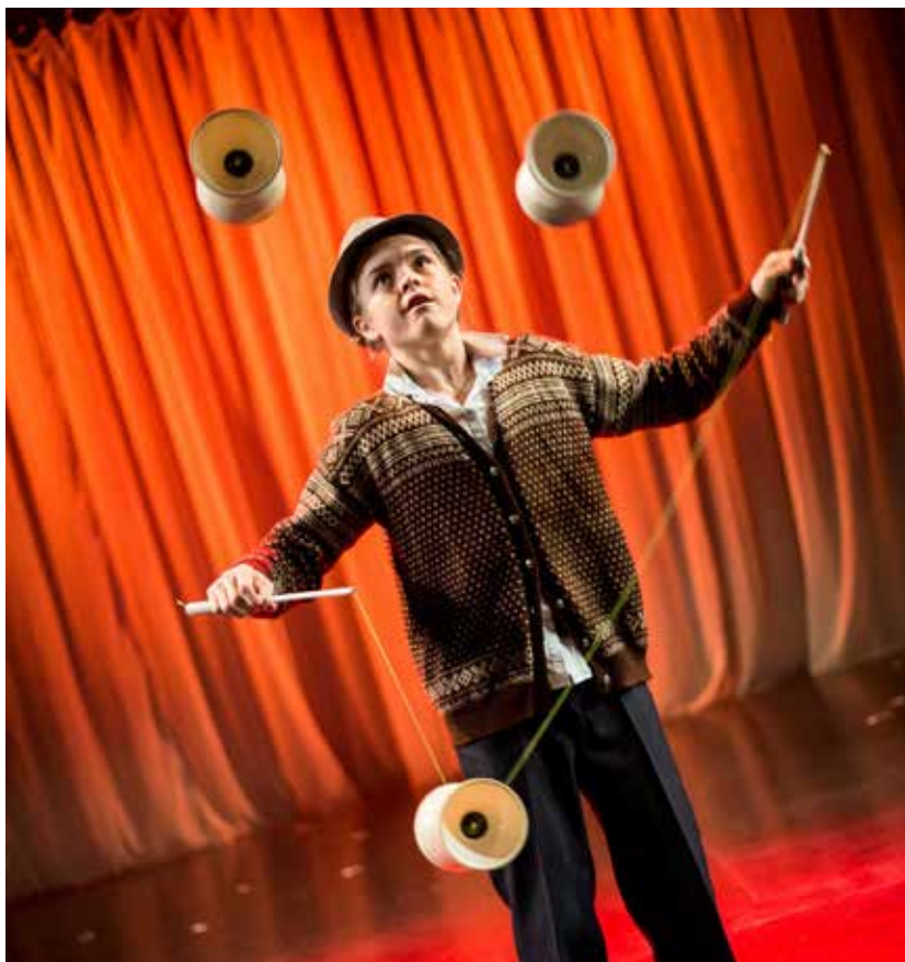
Bilde 1. Diabolo i bruk ved TKKs forestilling Cirquante Ungdom høsten 2016.

Observasjon av hyppigheten av trening og repetisjon av øvelser i det empiriske materialet tyder på at dette er noe lærerne vektlegger, og som de må legge vekt på i elevenes læring i sirkuskunståget. Både Maja og Silja sier det ettertrykkelig: De ønsker at elevene skal trene mer, både i egen- og gruppedisiplin, kanskje helst hver dag. Betydningen av repetisjon av øvelser gjentas om og om igjen. For sirkuskunstlærerne hender det ofte at undervisningstiden er så knapp at de raskere enn ønskelig må gå videre i undervisningsprogrammet. Tid trekkes fram som en viktig rammefaktor. Det beskrives av begge forskningsdeltakerne som en nødvendighet for de som ønsker å satse, å trene oftere enn en til to ganger i uken. Det tredje observasjonsnotatet knyttes til Majas undervisning om bruk av sjongleringsredskapet diabolo (Se bilde 1).