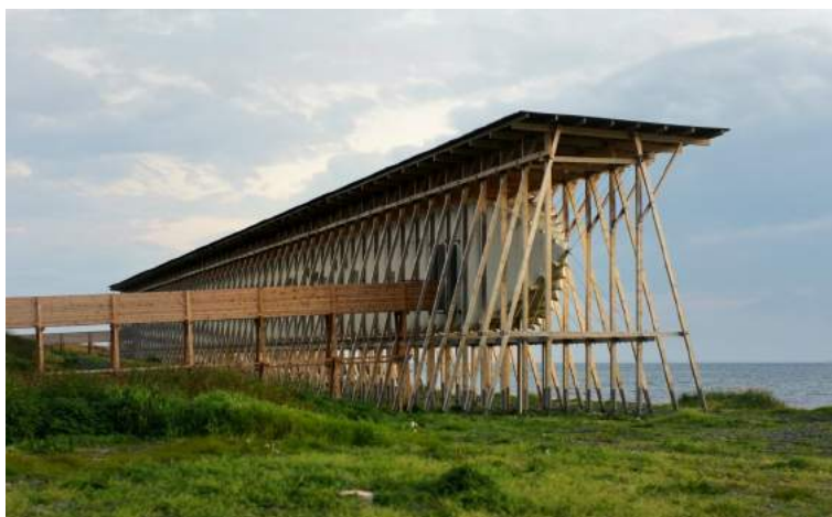
Figur 33. Minnehallen på Steilneset minnested ved Vardø, åpnet i 2011 av H.M. Dronning Sonja.

Minnehallen (figur 33) er åpen for publikum, og den innvendige gangen er opplyst av 91 glugger med en minnetavle i hver – en for hvert offer. Her får besøkende informasjon om de ulike prosessene som fant sted. På denne måten inkluderes vi – folk – i den vonde, traumatiske historien. «Vi» får ta del i de grusomme hendelsene som fant sted for 3-400 år siden.