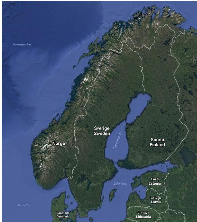
Figur 5. Skandinavisk halvøy.

Grunnet valgte problemstilling, var et område preget av en vekslende politisk historie ønsket. Både Norge og Sverige har vært gjenstand for skiftende statsoverhoder og ledere, samt, i nyere tid, parlamentariske regjeringer. Den geografiske avgrensningen gjorde det også mulig å gjennomføre en kvantitativ analyse av et nært fullstendig sett empirisk materiale.