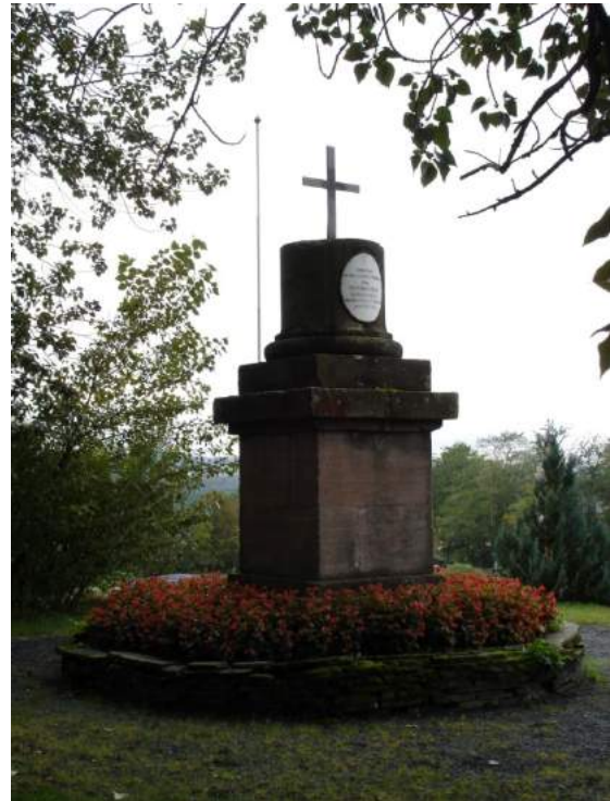
Figur 46. Olavsstøtta på Stiklestad, reist 1807, til minne om slaget på Stiklestad i 1030 hvor Tore Hund tok livet av Olav den Hellige.

Flere aktører, for eksempel fylkesmannen i Nord-Trøndelag og Justismuseet på Kalvskinnet i Trondheim, har ønsket å avdekke minnesteinen («NS-bautaen») for å stille den ut eller synliggjøre denne delen av krigshistorien. Dette har imidlertid ikke skjedd på grunn av motvillighet fra grunneieren, Fortidsminneforeningen, og minnesteinen er fremdeles gravd ned – symbolsk borte fra folks minne. Men debatten rundt en eventuell avdekking er stadig pågående, det må en gang avklares hva stedet skal symbolisere – dette blir spesielt viktig når vi nærmer oss 1000-årsjubileet for slaget på Stiklestad 146 . Det er mulig at det kommer en tid hvor minnessteinen faktisk graves opp igjen.