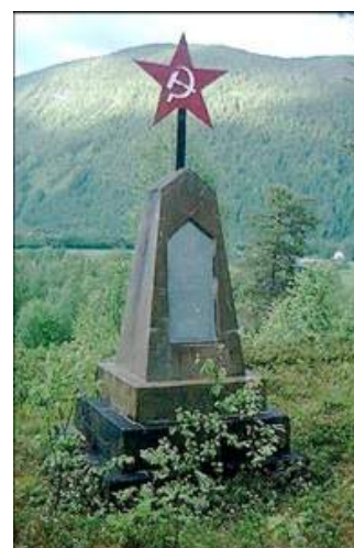
Figur 19. Minnesmerke på Sundby hvor en fangeleir lå tidligere. Reist av medfanger.

Sovjetiske krigsminnesmerker som er reist av medfanger under og umiddelbart etter frigjøringen av andre verdenskrig, blir også behandlet som ett monument. De er alle reist innenfor tidsrommet 1942-1945, og de er svært likt utformet. De aller fleste har en pyramideform med en rød stjerne på toppen (se figur 19 som eksempel).