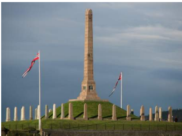
Figur 1. "Haraldsstøtta" ved Haugesund, et minne om Harald Hårfagres samling av Norge i 872 AD. Foto: PrevinNK 2007 via www.snl.no . Lisens: CC BY-SA 3.0.