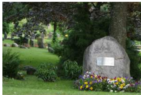
Figur 41. Minnessteinen over massegraven på Gaustad, kalt "Skrekkens stein".

To minnessteiner uten kjent oppføringstidspunkt, faller også innenfor denne kategorien; Gaustad (figur 41) og Vipeholm (figur 42) 136 . Begge minnessteinene står over en massegrav hvor ofre for statlig eksperimentering (for eksempel lobotomi og sult) er gravlagt. Selv om disse ikke kan kategoriseres som massedrap, inkluderes dem her på grunn av deres verdi som mot-monumenter – monumenter som kan fortelle mye om vår tid. Ofrene var mennesker som stod utenfor samfunnet, blant annet åndssvake, funksjonshemmede og (antatt) tatere.