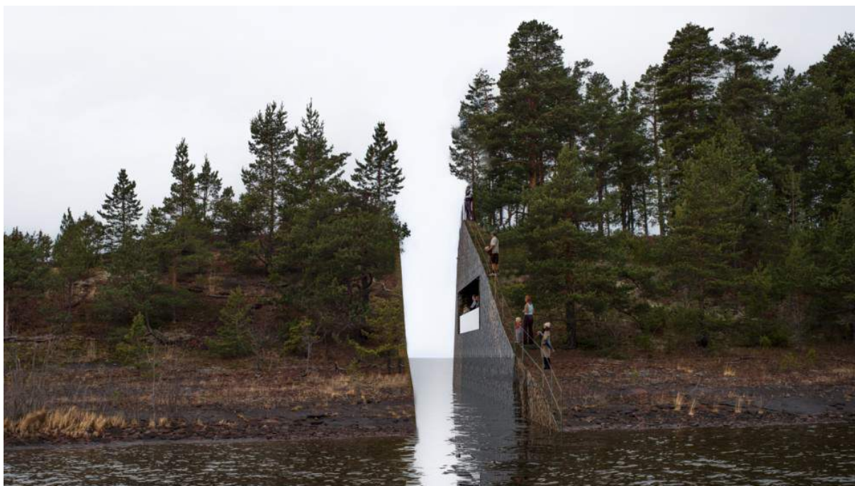
Figur 43. Det planlagte, men svært omdiskuterte, "monumentet" over massakren på Utøya.

Det er ønsket et minnesmerke over «Blodbadet i Rønneby», noe som vil bli et mot-monument dersom det oppføres. Massakren er et svært vondt kapittel i Sveriges historie, og er nok noe av grunnen til at hendelsen ikke har blitt skrevet i stein enda.