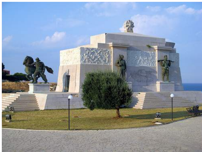
Figur 9. Monument til minne om arbeidere og soldater fra Siracusa, Italia som falt for den italienske stat i Afrika. Reist og bygd av fascistene i 1938.

Voortrekkermonumentet 32 i Pretoria, Sør-Afrika (Figur 11) og monumentet til minne om arbeidere og soldater fra Siracusa, Italia som falt for den italienske stat i Afrika (Figur 9). Sistnevnte monument er helt klart et maktbyggverk, den er både symmetrisk, stor og tung – tre maktuttrykk i følge Thiis-Evensen 33 , noe jeg vil komme tilbake til senere i avhandlingen.