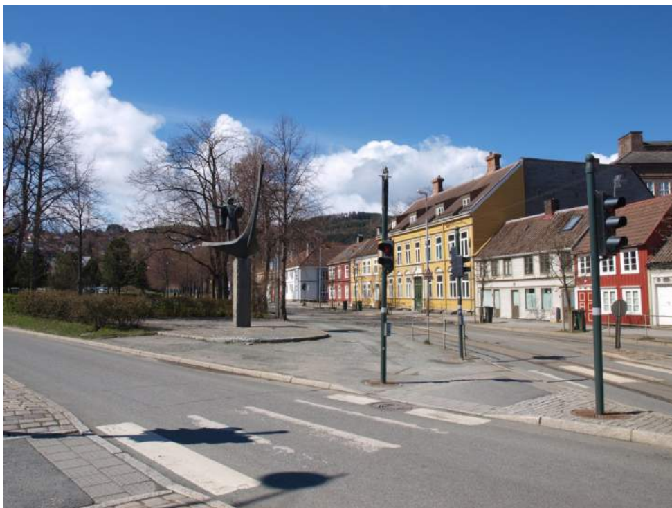
Figur 38. Monumentet over slaget ved Kalvskinnet, hvor Kongens gate deles i to.

Ble monumentet over slaget på Kalvskinnet reist her for å fylle tomrommet som hadde åpnet seg i det urbane bildet uten en skjult, politisk agenda? Dette spørsmålet kan trekkes lenger – dersom det ikke hadde stått et slag på Kalvskinnet i 1179, ville man ha reist et hvilket som helst monument her? Dersom dette er grunnen til oppføringen av monumentet, kan man argumentere for at plasser kan fungere imperativt; plassen som sådan kan legge føringer for hvor og om det skal reises monumenter, uavhengig av historisk betydning.