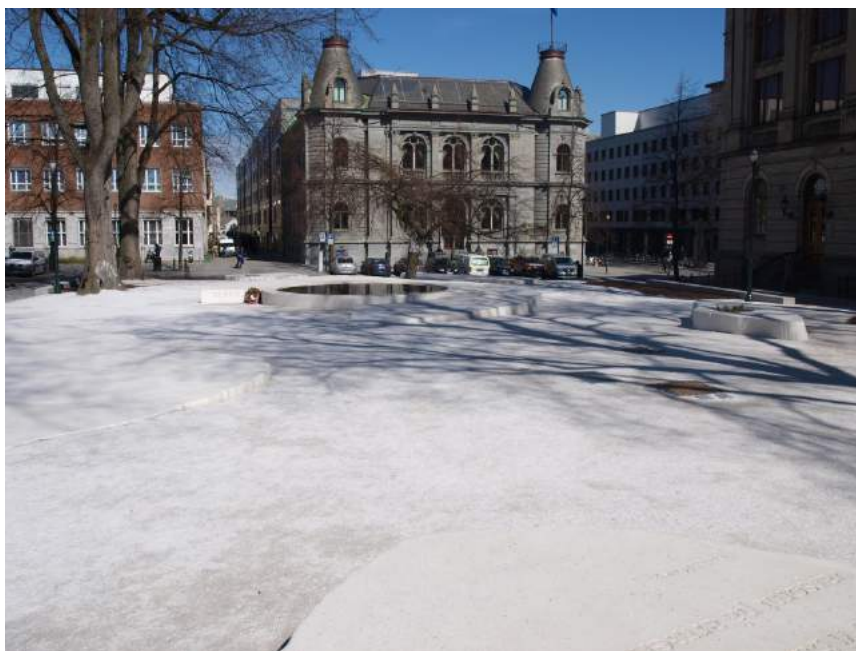
Figur 35. Terra Incognita – den hvite plassen, monumentet i Trondheim som minnes ofre for Utøya-massakren 2011. Besøkende inviteres «inn» i monumentet.