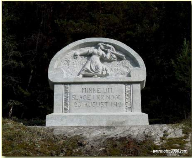
Figur 7. Monumentet "Pillarguri" over slaget ved Kringen i 1612, hvor en norsk bondehær angrep skottehæren på vei til Sverige.

De ukjente, lokale heltene og soldatene ble også minnet. Et eksempel på en lokal helt som fikk stå i sentrum av et slag, er monumentet over slaget ved Kringen reist i 1912, nemlig «Pillarguri» (figur 7). «Pillarguri» er den mest kjente personen fra slaget ved Kringen (mulig