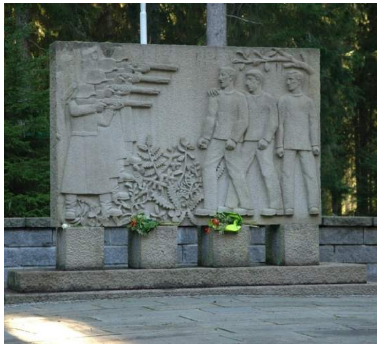
Figur 36. Monumentet ved Falstadsbogen, over ofre fra andre verdenskrig som ble henrettet her i 1942-43. Reist i 1947 og avduket av H.K.H. Kronprins Olav.

For å se disse monumentene må folk ha gjort et aktivt valg