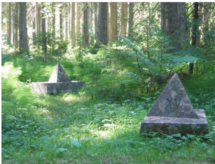
Figur 37. Steinpyramider i Falstadskogen, reist i 1963 over kjente massegraver.

Disse politiske holdninger rundt verdier har endret seg, noe vi kan «lese» av plasseringen av de senere reiste monumentene i Falstadskogen. Steinpyramidene (se figur 37) som ble oppført i 1963 er ikke synlig fra veien og står rett over kjente massegraver i skogen. Disse tiltrekker seg ikke oppmerksomhet, de besitter heller ingen av Thiis-Evensens maktuttrykk. Plasseringen kan vitne om at vi skal minnes ofrene – det er litt mer «intimt».