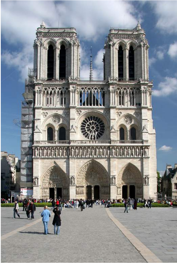
Figur 13. Notre Dame på Île de la Cité, Paris. Bygd i gotisk stil mellom 1163 og 1345. Bygningen uttrykker makt gjennom egenskapene tyngde, størrelse, avstand, symmetri og vertikalitet . Foto: Tristan Nitot 2005 via no.wikipedia.org. Lisens: CC BY-SA 3.0.

Arkitekturhistorien viser, i følge Thiis-Evensen, at bygninger som bevisst er formet for å uttrykke makt, har benyttet et bestemt sett av virkemidler. Virkemidlene har blitt vist å gå igjen, enten alene eller i en slags kombinasjon. Gjennom historien har i særdeleshet seks egenskaper med jevne mellomrom gått igjen i «maktbygg»: