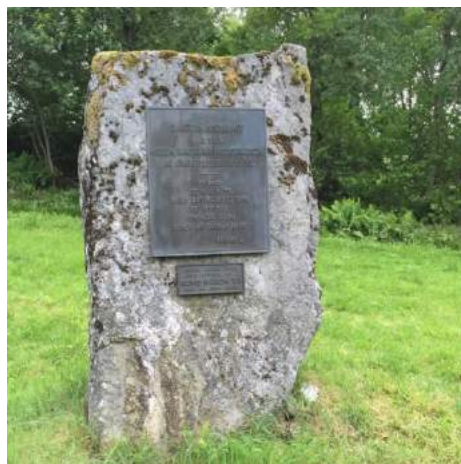
Figur 31. Monument reist over slaget ved Rastarkalv, oppført under 1000-årsjubileet i 1955. Monumentet besitter den maktskapende egenskapen avstand .

Monumentenes utforming og hyppigheten av oppføring viser at de nå er flere, mindre og mer horisontale enn tidligere. De besitter med andre ord færre maktuttrykk enn tidligere. Aktør-nettverksteorien sier at dersom oversettelsen avtar, vil påvirkningen også avta. Dette betyr at færre tilstedeværende maktskapende egenskaper gjør at monumentene har lavere påvirkningseffekt på mennesket, og at muligheten for endring i bruksmønster reduseres.