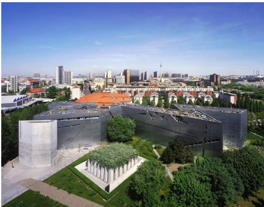
Figur 16. Det jødiske museum i Berlin illustrerer hvordan den inngangsløse veggen med minimalt av vinduer uttrykker lukkethet . Foto: Studio Daniel Libeskind 1999 via en.wikipedia.org. Lisens: CC BY 3.0.

Lukkethet er et maktskapende element ved at det assosieres med avvisning og utestengning. Det skjuler noe, og blir dermed mystisk. I møte med slike byggverk kan man fort føle seg maktesløs 106 . Eksempler på lukkede bygg er Firenzes renessansepalasser med høye vegger og små åpninger som hindrer innsikt. Dersom egenskapen lukkethet skal være tilstede ved et monument, må det være klart at det stenger andre mennesker ute; bruk av gjerder eller vegger (eksempel på lukkethet , se figur 16).