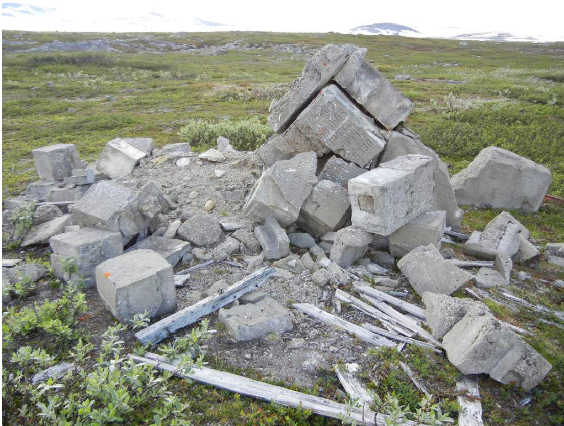
Figur 45. Ødelagt monument ved Bjørnelva, Saltfjellet.