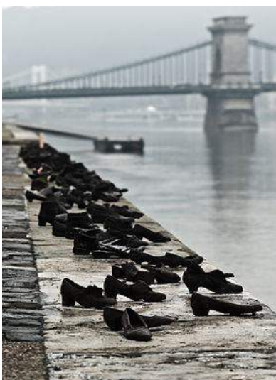
Figur 2. "Skoene ved Donau" (til minne om ofrene skutt av den fascistiske organisasjonen Arrow Cross i 1944-45). Foto: Nikodem Nijaki 2012 via en.wikipedia.org . Lisent CC BY-SA 3.0.