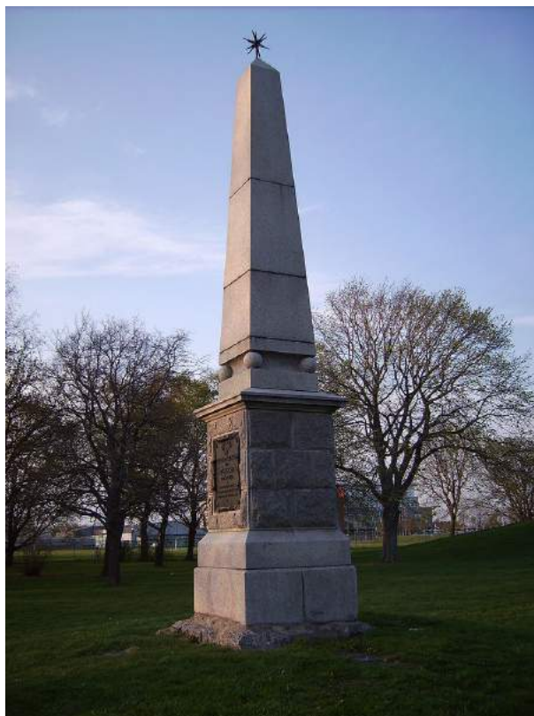
Figur 23. Stångebromonumentet, reist i 1898, til minne om slaget ved Stångebro i 1598. Monumentet er et sitat av den egyptiske obeliskens. Foto: Harri Blomberg 2007, commons.wikimedia.org . Lisens: CC BY-SA 3.0.