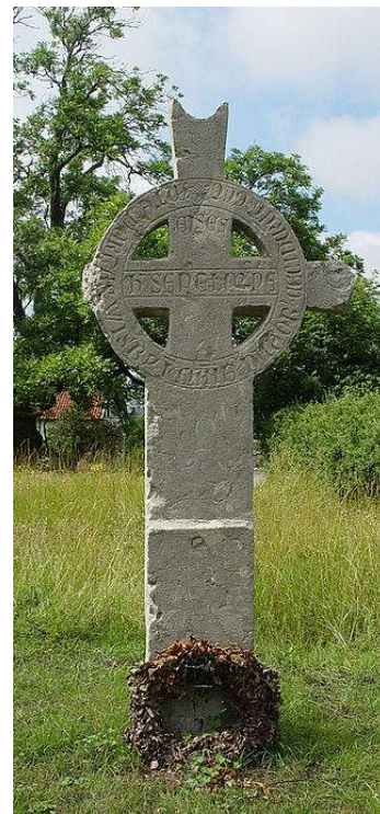
Figur 22. Steinkorset på Korsbetningen, Visby, fra ca. 1380. Foto: Jürgen Howaldt 2005, sv.wikipedia.org. Lisens: CC BY-SA 3.0.

Selv om det ikke er reist noen monumenter som fremdeles står før dette tidspunktet på avhandlingens geografiske område, ble det på Korsbetningen (navnet kommer fra «beitet rundt korset»), Gotland, reist et minnesmerke ca. 1380 over de falne 116 fra slaget utenfor Visbys ringmur i 1361. Dette er et av få i Norden som er reist før 1800. Steinkorset på Korsbetningen er også et av de aller tidligste kollektive minnene 117 .