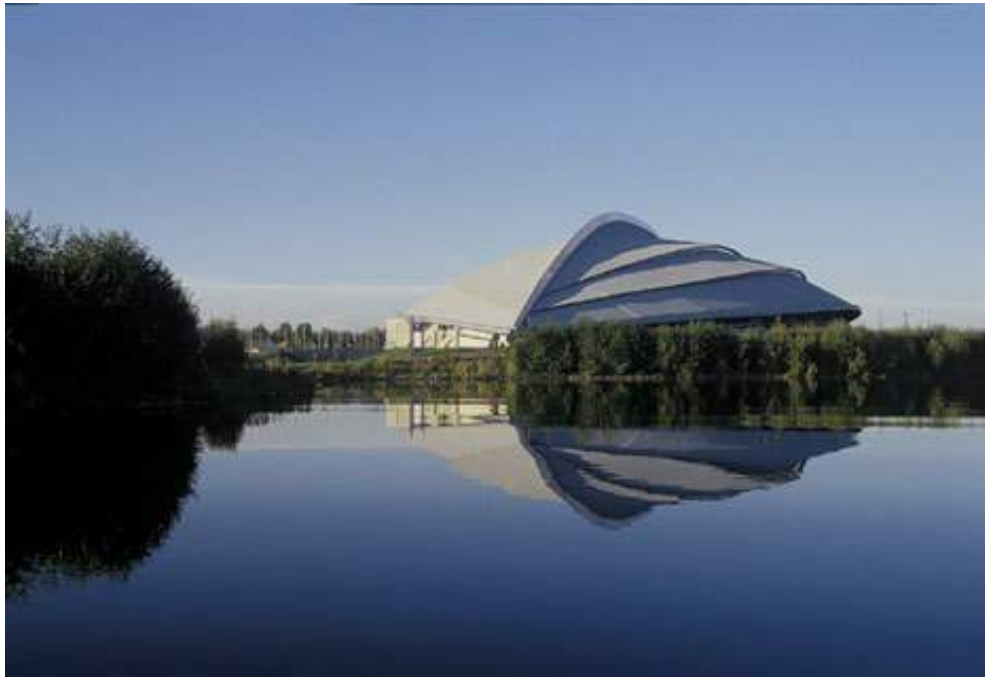
Figur 14. Skøytehallen "Vikingskipet" på Hamar ligger ved Åkersvika på østsiden av byen, hallen åpnet i 1992. Bygningen uttrykker makt gjennom egenskapene størrelse, avstand og symmetri. Dette er et sted for verdensrekorder, ikke et barns første skøytetak.