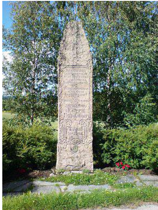
Figur 20. Monumentet over slaget ved Toverud, Aurskog, i 1808, mellom Danmark-Norge og Sverige som en del av napoleonskrigene.

Monumentene med ukjent alder ble sortert alfabetisk i en annen katalog, men med merknad om hvilken tid de mest sannsynlig tilhørte på grunnlag av deres utforming og hvilke hendelser de minnet. Dette var blant annet tilfelle med monumentet over slaget ved Trangen i 1808. Likheten mellom monumentene på Trangen og Toverud (figur 20 og 21) er slående, noe