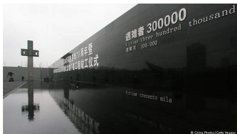
Figur 8. Nanjing Massacre Memorial, Kina.

Et eksempel på et monument reist over en massakre er Nanjing Massacre Memorial. Den 13. desember 1937, under den andre kinesisk-japanske krig, erobret japanske styrker Kinas daværende hovedstad Nanjing. I løpet av de neste 6 ukene antas det at inntil 300.000