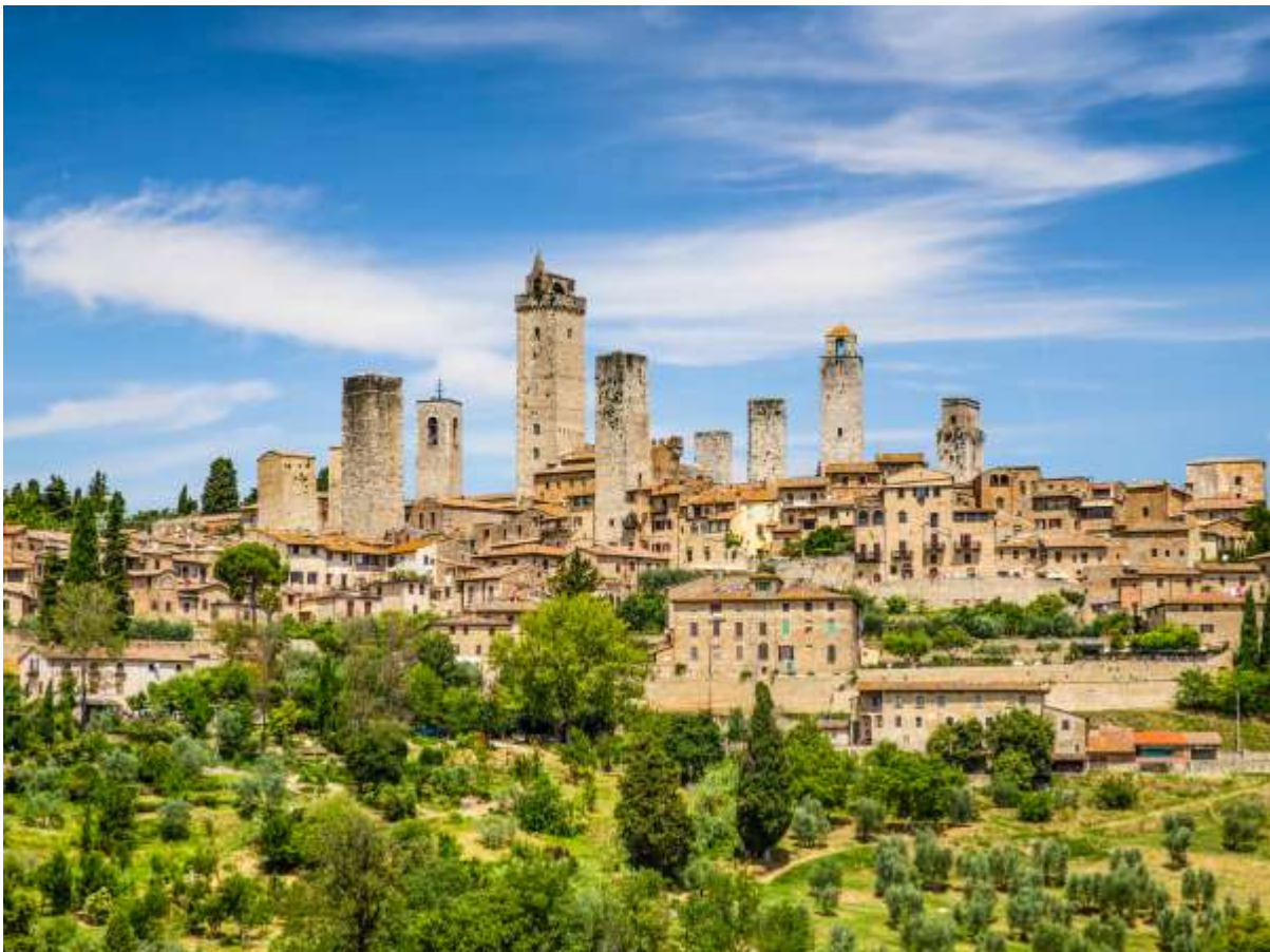
Figur 15. Adelstårnene i San Gimignano, Italia. Disse uttrykker makt gjennom deres felles egenskap vertikalitet – familiene i byen konkurrerte om å bygge høyest tårn.