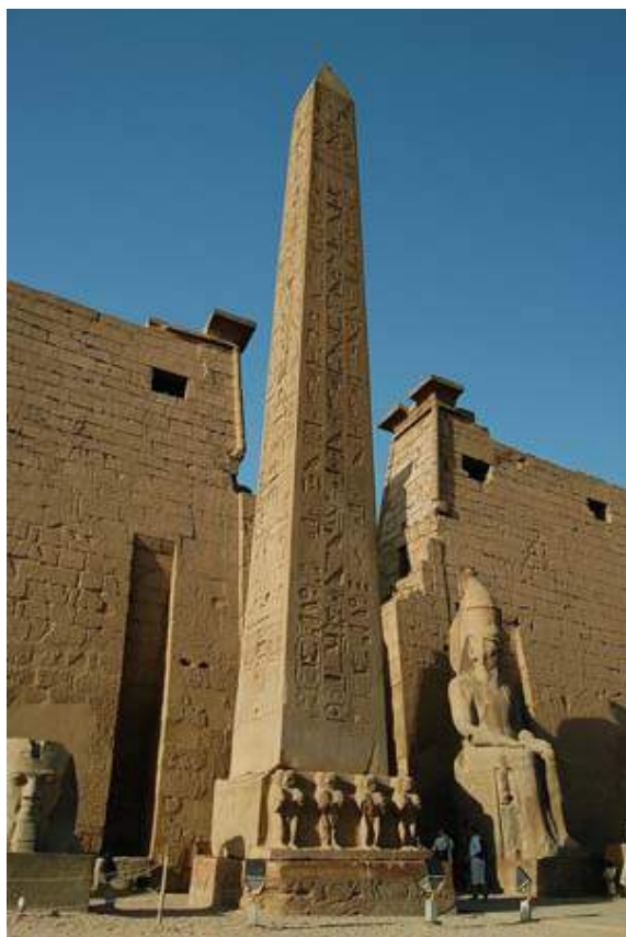
Figur 24. Obeliskens ved Luxortempelet, Egypt.

Et eksempel på et monument med klare likhetstrekk med (egyptisk) obelisk (se figur 23 som eksempel), er Stångebromonumentet (figur 24), reist i 1898. Monumentet er en høy, slank søyle med et kvadratisk tverrsnitt. I tillegg er steinen polert og bearbeidet – det kommer tydelig frem at noen har lagt ned store ressurser for å produsere det og gi den en form som siterer obeliskens.