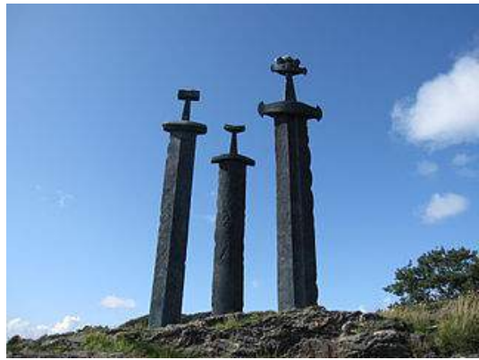
Figur 4. Monumentet over "Sverd i fjell" ved Hafrsfjord, reist i 1983.

fortidige hendelser – det være seg traumatiske eller heroiske. Dersom grusomhetene skjedde i forhistorien, kan disse monumentene skape en samlende nasjonalfølelse i folket. Et eksempel på dette er Sverd i fjell ved Hafrsfjord. Monumentet står som en materiell representasjon av samlingen av Norge under Harald Hårfagre, noe som kan forventes å ha vært en blodig kamp om territorier, samt som et fredssymbol på at sverd, i betydning av våpen, aldri igjen skal tas i bruk.