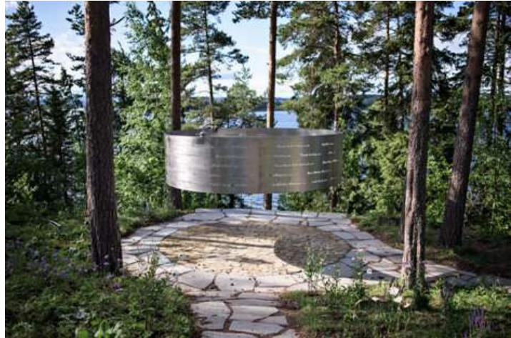
Figur 34. Utøya-monumentet reist i 2015 på øya, til minne om de 69 ungdommene som ble frarøvet livet 22. juli 2011.

Den samme egenskapen kan også tildeles 22. juli-monumentet Terra Incognita (latin for «ukjent jord», figur 35), plassert øst for Vår Frues kirke i Tordenskioldsparken, Trondheim. Her inviteres vi inn til det ukjente territoriet som åpnet seg i våre individuelle, felles og politiske liv sommerdagen i 2011.