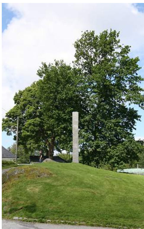
Figur 40. Heksesteinen i Bergen.

Materialet i denne avhandlingen viser forekomsten av slike mot-monumenter etter tusenårsskiftet. I 2002 og 2011 ble det reist tre monumenter/minnsteder som minnes ofrene for hekseprosessene (Heksesteinen i Bergen (figur 39), Heksemonumentet på Anda (figur 40) og Steilneset minnsted (figur 33)) – et svært taushetsbelagt tema i samfunnet. Håndteringen av «heksere» av den norske stat har vært tiet i hjel, og først nå kommet ut fra skyggen og frem i minnelandskapet.