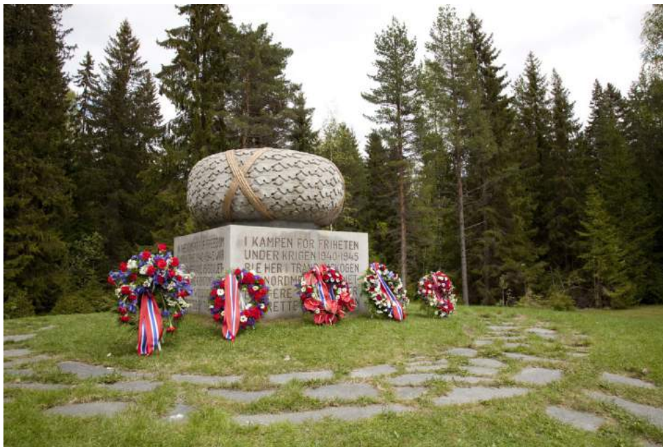
Figur 26. Monumentet ved Trandumskogen hvor 173 nordmenn, 15 sovjetiske borgere og seks briter ble henrettet av tyskerne (informasjon hentet fra inskripsjonen på selve monumentet) under andre verdenskrig. Det ble reist i 1954 under tiårsmarkeringen for henrettelsene, og går innenfor kategorien delvis luftig .

Analysen viste at flere har stor avstand til omgivelsene på den ene siden – i betydningen av at de er luftige på den siden som kvalifiseres som «foran» på monumentet. «Foran» kan være siden med inskripsjon eller relieffer, som for eksempel monumentet ved Falstadskogen reist i 1947 (se figur 36). Andre eksempler på monumenter som er luftige på den ene siden, er Trandumskogen, Ullensaker (figur 26) eller monumentet over slaget ved Sävar reist i 1909 (figur 27).