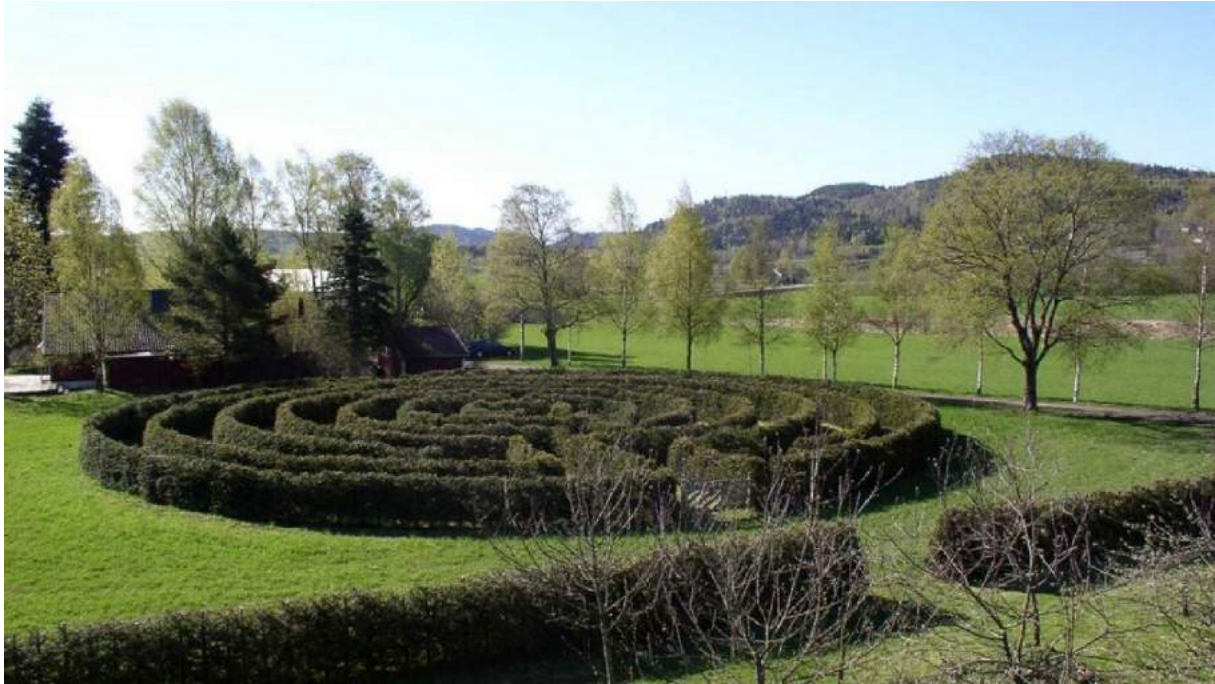
Figur 28. Labyrinten ved Stange gjestegård, Ramnes. Den minnes slagene på Re i 1163 og 1177, og ble reist/plantet i 1992. Labyrinten består av 1177 grantrær. Her har det tydelig stått en landskapsarkitekt bak utformingen av monumentet.

Tyngde er en egenskap som viser seg tydelig hos fem av monumentene, som for eksempel Sävar (se figur 27) og de sovjetiske krigsminnene. Monumentene som uttrykker tyngde er alle reist i tiden før 1946, noe som passer med forekomsten av de andre maktuttrykkene. Hverken størrelse eller tyngde kan regnes som et vanlig element blant monumenter på den skandinaviske halvøy.