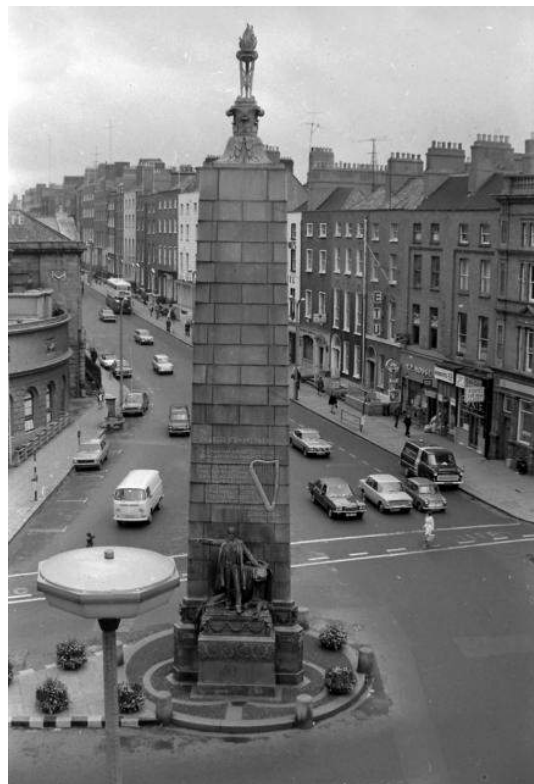
Figur 10. Parnellmonumentet i Dublin uttrykker makt gjennom høyden.