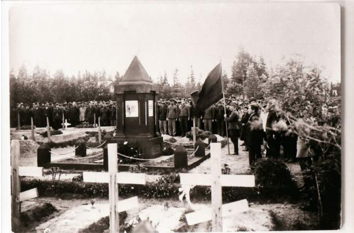
Figur 44. Sovjetisk monument reist av overlevende i 1945 på «russerkirkegården» i Mo i Rana. Bildet er fra avdukingen av monumentet. I forgrunnen kan bysantinske kors ses, noe som viser avstanden til staten ved at disse er oppført i et land preget av andre religioner.