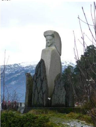
Figur 3. Heksemonumentet i Anda, til minne om kvinnene som ble brent på bålet i Anda. Foto: C. Hill 2007 via no.wikipedia.org . Lisens CC BY-SA 3.0.

mange mennesker de eneste minnene, eller monumentene, etter de «usynlige» kamp mot undertrykkelsen.