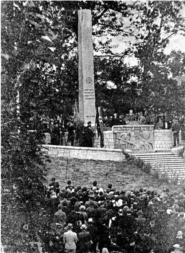
Figur 47. NS-monumentet reist i 1944 og innviet av Vidkun Quisling, som her står bak relieffet og taler til folket.