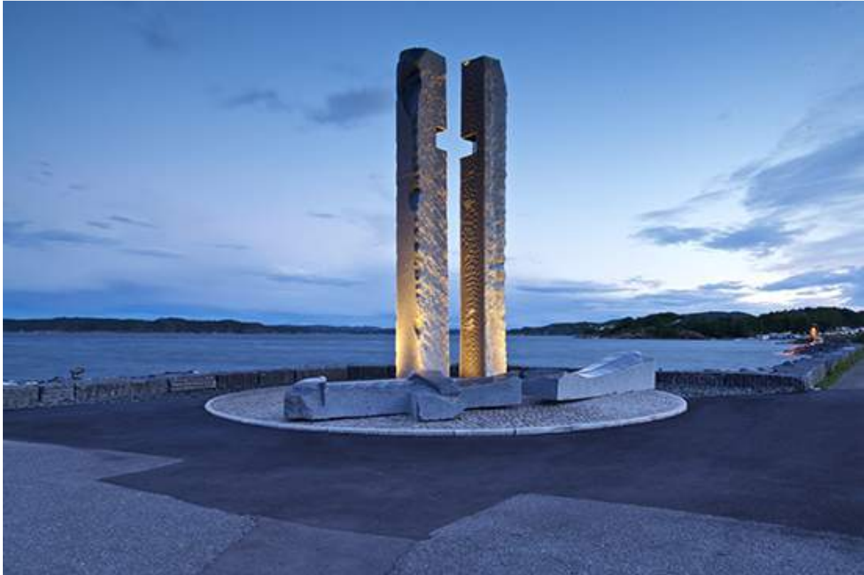
Figur 32. Monumentet over slaget ved Nesjar i 1016.