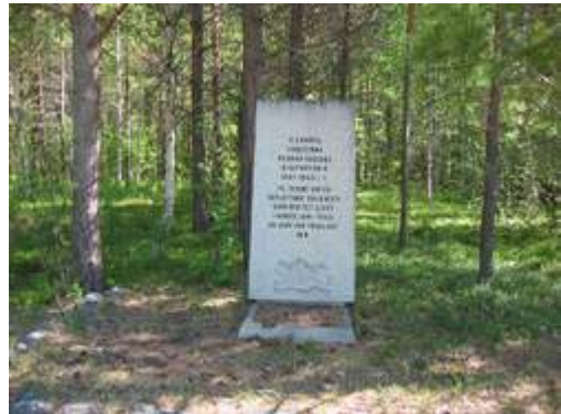
Figur 17. Standardstøtte reist til minne om de sovjetiske soldatene som mistet livet under andre verdenskrig i Norge, og som var gravlagt hvor støtta er oppført.

Flere av monumentene og minnesmerkene som har blitt oppført, spesielt fra verdenskrigene, har for best mulig gjennomførelse av analysen, blitt samlet til ett felles monument. Det gjelder 29 standardstøtter (figur 17) som er reist over sovjetiske krigsfangers tidligere gravsteder av Krigsgravtjenesten. Gravene ble under Operasjon Asfalt 110 i 1951 tømt og likene flyttet til Tjøtta krigskirkegård. Den norsk-sovjetiske krigsgravkommisjonen besluttet 1. juli 1954 hvor støttene skulle stå og hvordan de skulle se ut 111 . Standardstøttene er alle identiske; like store, samme inskripsjon 112 og lik utforming.