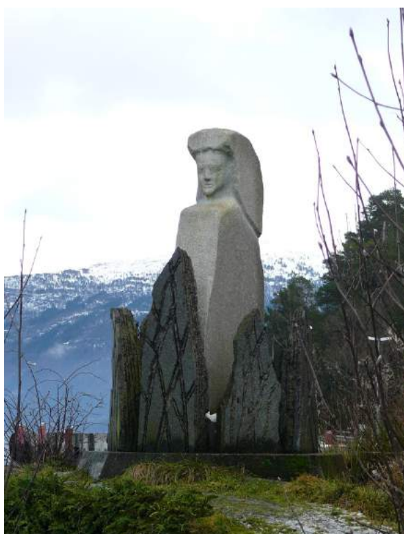
Figur 39. Heksemonumentet på Anda.