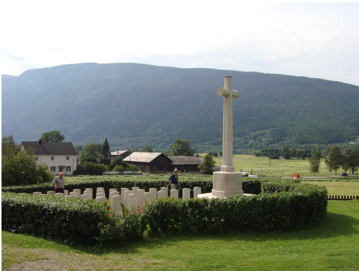
Figur 18. Fellesmonument og individuelle gravstøtter for allierte soldater på Nord-Sel kirke.

både individuelle og uniforme, og sammen med dem ofte et fellesmonument. Fellesmonumentet er reist til minne om de britiske soldater som døde i nærområdet, ofte i slag og kamper. Disse fellesmonumentene vil samles til ett monument i analysen. Monumentene har lik utforming, er symmetriske og ruver ofte på kirkegårdene. Et eksempel på et slikt fellesmonument er ved Nord-Sel kirke (figur 18).