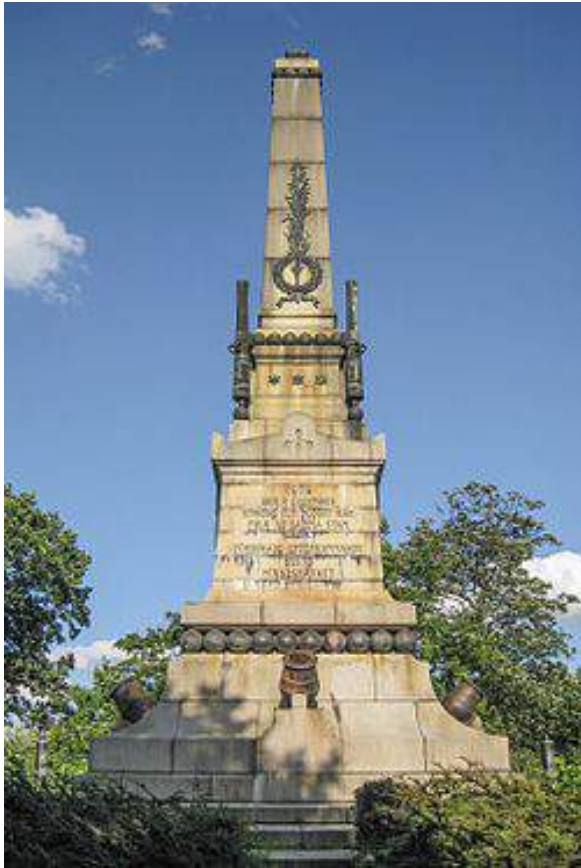
Figur 29. Monumentet over slaget ved Lund i 1676. Det første ble reist i 1883 i betong etter at planleggingen startet i 1876, men senere revet og byttet ut med dette i granitt som kom opp i 1930. Monumentet besitter vertikalitet, avstand, tyngde og symmetri, og har dermed en sterk inskripsjon.

Tiden mellom 1940 og 1953 er preget av monumenter med én eller ingen maktuttrykk tilstede, med unntak av monumentet på retterstedet på Akershus festning. Etter 1953 forekommer innslag av elementer med to eller flere maktsøkende elementer, selv om disse er sjeldnere etter 1950 enn før andre verdenskrig.