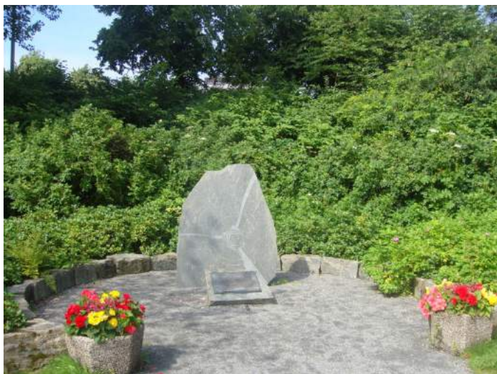
Figur 30. Krigsminnesmerket over de britiske soldatene som mistet livet i 1944 etter at deres fly ble skutt ned over Nygårdstangen, Bergen av tysk forsvar. Det besitter hverken egenskapen vertikalitet eller symmetri .

og Skotterud/Matrand3), i motsetning til 7,7 % før andre verdenskrig, noe som viser at denne typen monument også har fått merke endringen og utviklingen av monumentenes utforming, selv om de aller fleste besitter to eller flere maktuttrykk.