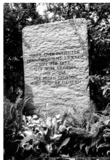
Figur 42. Minnessteinen over massegraven ved Vipeholm. Inskripsjonens siste del lyder: "Var resan stormig, huru schön är hamnen".

Minnessteinene er små og «usynlige», i motsetning til monumentene over hekseprosessene, noe som kan være påvirket av vårt forhold til hendelsene på Gaustad og Vipeholm. Statlig eksperimentering på disse to institusjonene foregikk på midten av 1900-tallet, og står dermed fremdeles sterkt i minnet.