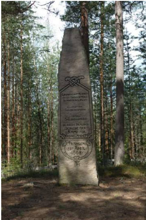
Figur 21. Monumentet over slaget ved Trangen, nord for Kongsvinger, i 1808, mellom Danmark-Norge og Sverige som en del av napoleonskrigene.

For å få best mulig oversikt over materialet, ble monumentene sortert kronologisk, etter tiden de ble oppført, i skjemaet. På denne måten ble det lettere å se trender i monumentenes utvikling i et langtidsperspektiv.