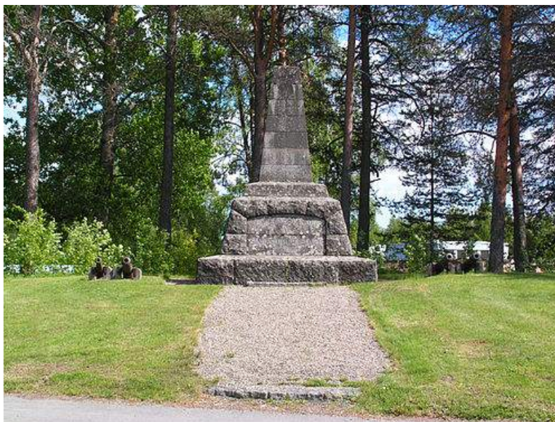
Figur 27. Monumentet over slaget ved Sävar i 1809. Slaget var det siste under finskekrigen som ble utkjempet mellom Sverige og Russland. Det ble reist i 1909. På folkemunne kalles monumentet "kannibalmonumentet" på grunn av inskripsjonen som lyder «Fäderneslandet åt sina stupade söner». Foto: Mikael Lindmark, sv.wikipedia.org. Lisens: CC BY-SA 2.5.