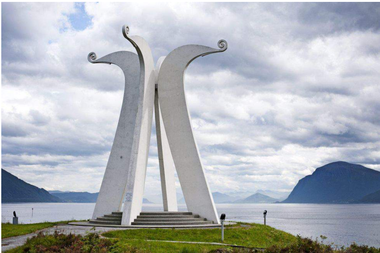
Figur 25. Monumentet over slaget ved Hjørungavåg i 986 A.D. som ble reist i 1986. Slaget stod, antakeligvis, på kysten av Sunnmøre, og stridende parter var jarlene på Lade, Håkon Sigurdsson og Eirik Håkonsson (Norge) mot en dansk invasjonsflåte sendt av Svein Tjugeskjegg – danskekongen. Monumentet besitter flere av maktuttrykkene valgt ut til analyse – vertikalitet , størrelse , avstand og symmetri – og kan sies å ha en sterk inskripsjon.

Et svært lite antall (seks) av monumentene reist for å minnes andre verdenskrig, besitter vertikalitet som en egenskap. Dette er trolig koblet til vår følelsesmessige tilknytning til hendelsene vi minnes. Vonde minner er ikke noe vi ønsker «tvunget» på oss i hverdagen, og dette kan være grunnen til at monumentene over andre verdenskrigs grusomheter stort sett ikke ruver i landskapet hvor disse hendelsene fant sted, men er mer «usynlige». Det har åpenbart skjedd noe med menneskenes tankesett som blir tydelig gjennom monumentene.