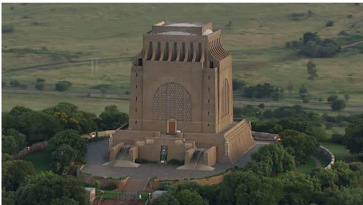
Figur 11. Voortrekkermonumentet ved Pretoria, Sør-Afrika, åpnet i 1949. Monumentet er en maktbygning gjennom bruk av egenskaper som tyngde, lukkethet, symmetri, vertikalitet og størrelse .

historisk analyse; case studiene bestod av Voortrekkermonumentet (figur 10), «trauma tours» 58 , Hector Pieterse-museet 59 og Apartheidmuseet. Hun skriver at bevaring av de «hvites» kulturminner og monumenter har blitt møtt med motstand, men viser samtidig hvordan Sør-Afrikas vonde historie fordøyes gjennom oppføring av, for eksempel, Freedom Park 60 på motsatt side av veien for Voortrekkermonumentet 61 . Her kommer befolkningens ønske om å inkorporere kulturarven – både den vonde og den gode – i regnbuestaten til syne, for selv en regnbue trenger fargen hvit (imperialistenes farge). I følge Meskell minner monumenter oss på at vold i det lange løp ikke automatisk reduserer forskjeller mellom folk eller løser problemer 62 .