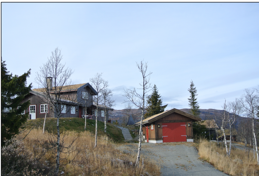
Figur 2: Høy standard på fritidsboliger. Bildet illustrerer standarden for nyere oppførte fritidsboliger i planområdet.

regnes med at litt under halvparten av fritidsboligene i kommunen finnes innenfor planområdet – Synnfjell Øst- Synndalen (Flognfeldt 2012). Undersøkelsen viser til statistikk som antyder opp mot 18% økning av antallet fritidsboliger i Nordre Land kommune i tidsrommet 2000-2010 (ibid,13). I følge denne hyttebrukerundersøkelsen er de fleste fritidsboligene i Synndalen oppført enten før 1971 eller etter 2004 (ibid, 24). Den største delen av utbyggingen av fritidsboliger i dette området skjedde altså før 1971 og etter 2004 (ibid.). Den økende etterspørselen etter fritidsboliger og økende næringsaktiviteten i dette området er med på å danne bakgrunnen for oppstarten av arbeidet med ny kommunedelplan for området. I planprogrammet beskrives en økende interesse tilknyttet utbygging av fritidsboliger og næringer knyttet til turisme i dette området (Nordre Land kommune 2013).