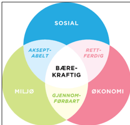
Figur 3: Tre dimensjoner ved bærekraftig utvikling. Vanlig framstilling av forholdet mellom de tre dimensjonene ved bærekraftig utvikling. Refsli, F. (2008) Bærekraftig utvikling . (Grafikk).

De tre dimensjonene ved en bærekraftig utvikling er, som vi ser ut i fra figur 3, gjensidig avhengig og gjensidig forsterkende. Det vil si at en bærekraftig utvikling forutsetter et samspill og en dialog mellom disse dimensjonene for at det skal være mulig å drive en bærekraftig utvikling. Med utgangspunkt i disse forståelsene av bærekraft nevner Brundtlandrapporten (1987) en rekke kritiske mål og vilkår som må ligge til grunn for å drive en bærekraftig utvikling. Jeg har tatt utgangspunkt i noen av disse kritiske målene rapporten nevner som jeg mener gjør seg gjeldende i min studie. Disse utvalgte kritiske målene er; 1) fortsatt vekst, 2) forandring av kvaliteten på veksten, 3) møte essensielle behov som arbeid, mat, energi, vann og sanitære forhold, 4) bevare og forsterke ressursgrunnlaget og 5) integrere miljø og økonomi i beslutningsprosesser (Elliott 2006, 13; Brundtland 1987)