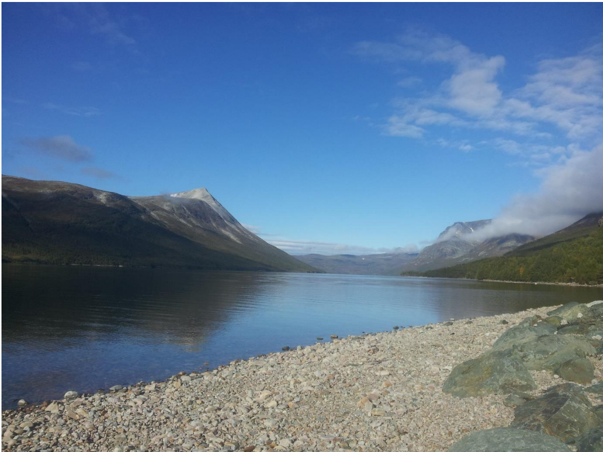
Figur 4. Utsikt fra Raudøra og vestover mot Vassenden.

I dette kapittelet presenteres funnene fra mitt datamateriale. Grunnet store informasjonsmengder etter lange og gode intervjuer, har jeg valgt å fokusere på det jeg anser som mest relevant for min studie. Temaene i det kommende vil være landskapsoppfatninger, bruk av landskapet og syn på landskapsendringer og sauebeite. Det er interessant med et lite historisk tilbakeblikk på Gjevilvassdalens utvikling for å få en økt forståelse av hvor informantene har hytte. Allerede i steinalderen oppsøkte mennesker Gjevilvassdalen (Taagvold & Haugland 1993). Veidemenn jaktet på reinsdyr, og det finnes spor etter fangstgraver den dag i dag. Svartedauden la Oppdals-området øde og etterpå ble ikke fangstanleggene brukt lenger. På slutten av 1500-tallet og frem til 1660-tallet var det stor vekst i antall gårder (ibid.). Figur 4 viser et bilde fra 2013 tatt fra Raudøra med utsikt vestover mot Vassenden.