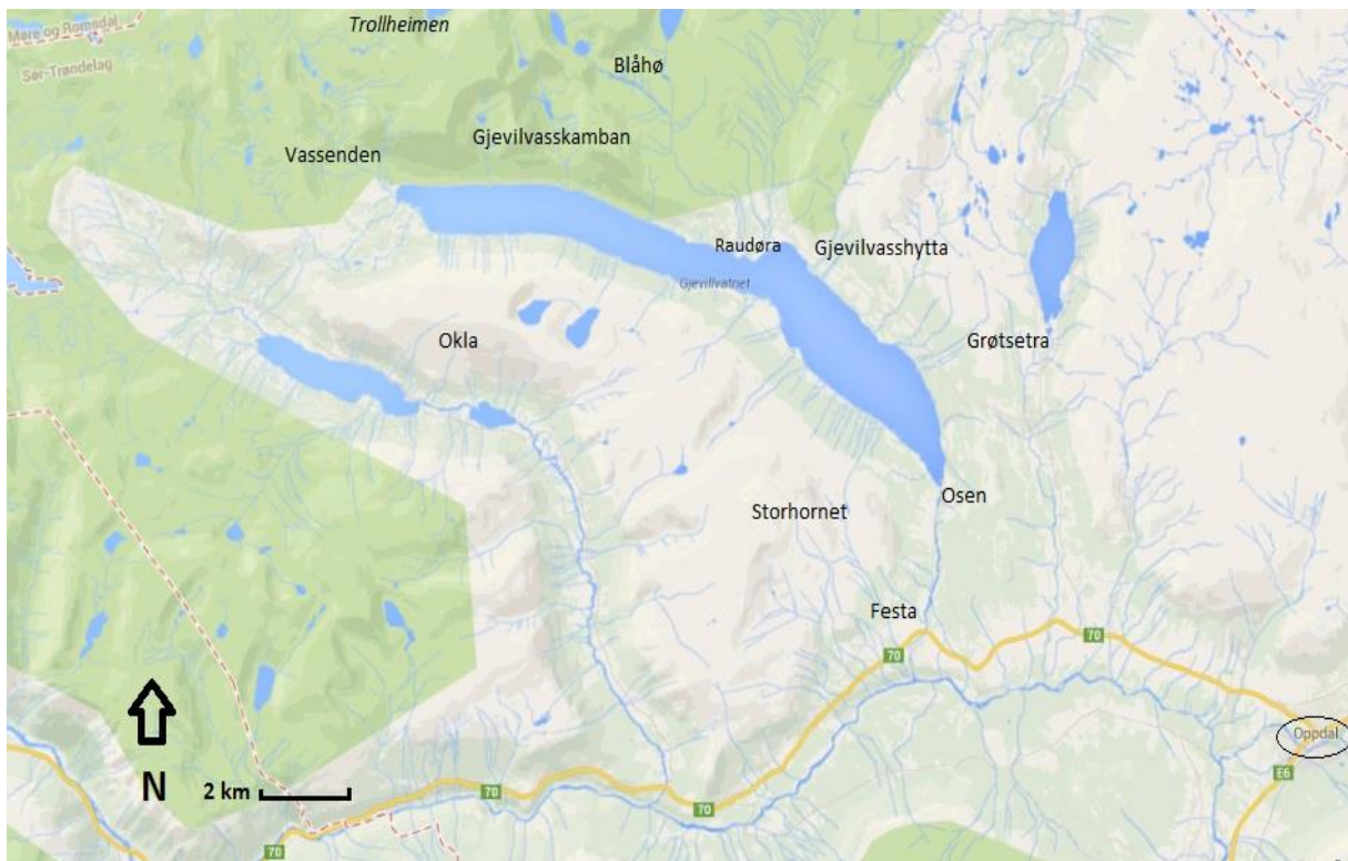
Figur 2. Kart over Gjevilvassdalen (Grunnlag: Kartdata 2014).

sauetetthet på 17 dyr per km 2 (Styringsgruppen for beiteplanrullering 2009), noe som regnes som lav tetthet.