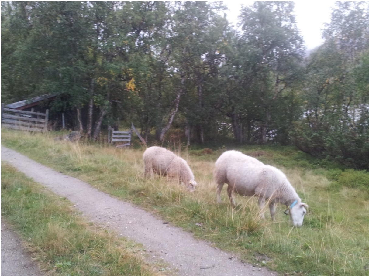
Figur 6. Beitende sau i Gjevilvassdalen.

«Vi har jo inngjerda hyttetomt, så det er ikke noen sauer som sitter på verandaen vår og driter for å si det sånn, så vi plages ikke av det. Og sauer er jo en del av en seterdal» (Ingvar).