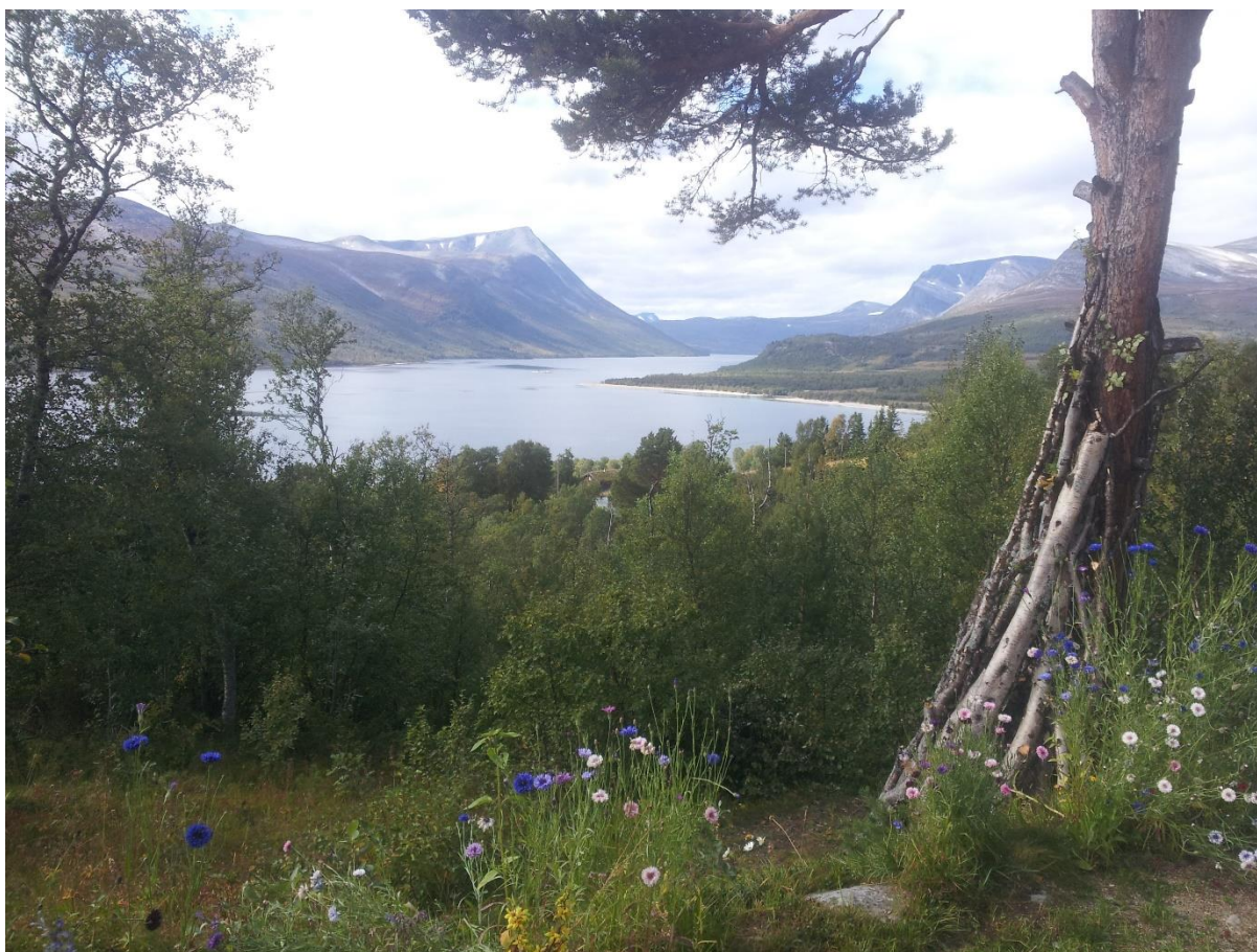
Figur 5. Utsikt over Gjevilvatnet, tatt fra en informants hytte litt oppe i lia.

«Jeg hadde satt pris på om det ikke hadde gjort det ja, du kan jo si, det føles nesten som at en ikke blir så mye oppi fjellet lenger. Det var mer fjell for tjue år siden enn det er nå, synes jeg da. Men om det har noen negativ betydning, det vet jeg ikke. Men jeg hadde satt pris på at det ikke var sånn» (Lars).