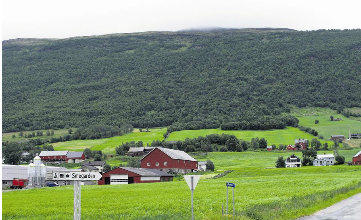
Figur 5.1 Parti mot Driva stasjon. Det øverste bilde er tatt sist på 1920-tallet. Nederste bilde er tatt i 2011.

Selve begrepet gjengroing har ulike betydning for ulike aktører og mennesker, hvor de fleste har en tendens til å knytte begrepet til negative effekter, for eksempel gjengroing av kulturlandskapet. Igjen er det andre for eksempel miljøorganisasjoner som ser på positive effekter ved gjengroing, for eksempel ved karbonlagring og bioenergi. Jeg vil som Bryn og