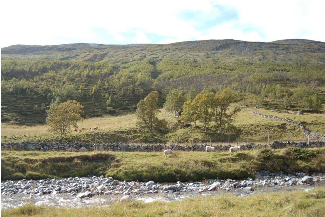
Figur 5.4 Parti fra Vinstradalen hvor det både er saue- og kubeite. (Foto: Forfatterens eget bilde).

kulturlandskap var en slik kartlegging nødvendig. Registreringen skulle ta høyde for at både de biologiske og de kulturhistoriske verdiene skulle være i fokus (Liavik, 1996; Miljødirektoratet, 2013a).