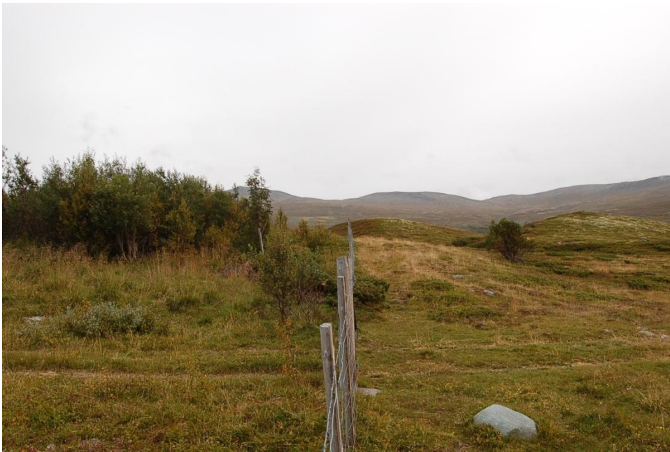
Figur 5.5 Viser skille mellom et område hvor det går beitedyr (høyre) og et område som er gjerdet inn og dermed ekskluderer beitende dyr.

Siden seterdrift er den driftformen som har satt sitt preg på Vinstradalen og Loslia, vil derfor kulturminner knyttet til denne driftsformen være det som er prioritert i skjøtselen av kulturminner. I utmarkslagets område er vegetasjonen stort sett preget av beite og slått. Derfor har de valgt å konsentrere seg om områder som ugjødslet beiteskog og beitemark. I slike områder er artsmangfoldet stort og er derfor i størst fare for endring ved annen bruk. På Miljødirektoratet sin naturbase ligger det områdebeskrivelser og skjøtselsplananbefalinger for områdene der det er blitt gjort en naturtypekartlegging. Her er mange av seterne i dalen tatt med, og for de fleste er truslene gjengroing. Tiltak for skjøtsel er i hovedsak beite (Miljødirektoratet, 2013b). Utmarkslagets skjøtsel av utmarksressursene er veldig ofte knyttet til å vedlikeholde kulturlandskapet i Vinstradalen som er utnevnt av Miljødirektoratet. Figur 5.5 illustrerer hvordan vegetasjonen i landskapet kan se ut med og uten beitende dyr.