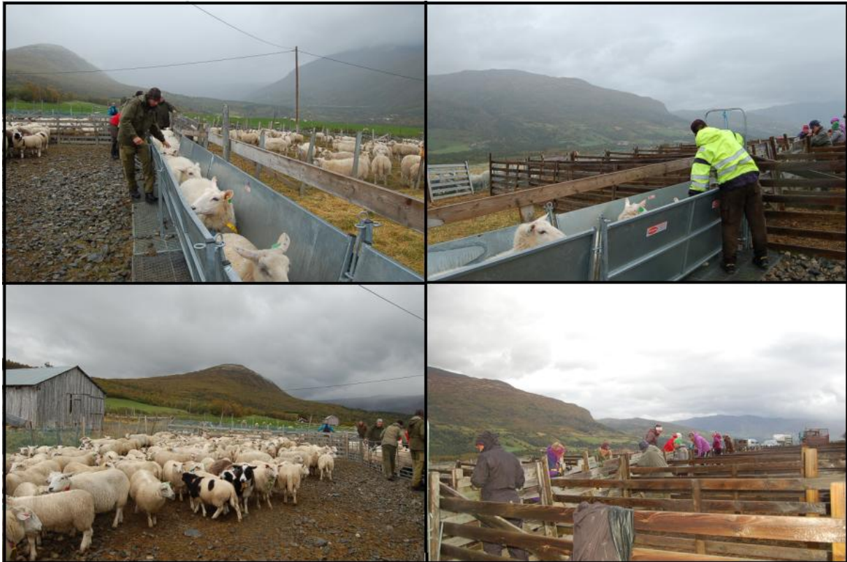
Figur 6.1 Bildene viser hvordan sorteringen av sauen i innhegningen foregikk. Først samles de i en stor felles innhegning, før de så blir ledet en og en inn til en port. Her konstateres det hvem den rettmessige eieren før sauen slippes videre slik at dyret blir ledet inn i båsen til den respektive bonden, som vist på bilde nederst til høyre.

men de legger også stor vekt på det sosiale samholdet. På turen bruker de å arrangere, som noen av bøndene kalte det, "en firmafest", hvor denne i hovedsak var forebehold bøndene selv. Selv deltok jeg på den siste dagen av sauesankingen i september 2013. Dette var den siste etappen av sankingen, hvor dyrene allerede var samlet et godt stykke ned i Vinstradalen. Ved inngangen til Vinstradalen har beitelaget en stor innhegning og en nybygd felleshytte som skal brukes til dette formålet, (se figur 6.1). Her føres sauen inn i innhegningen og sorteres, slik at de respektive bøndene får sine dyr hjem til egen innmark og gård.