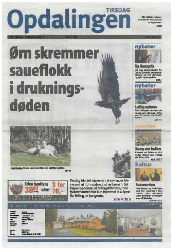
Figur 4.1 Faksimile. Ørn skremmer saueflokk i drukningsdøden. (Kilde: Avisen Opdalingen, Nr 95, 76.årgang. 27.08 2013).

rovdyr. Noen av de døde sauene tilhørte en av informantene mine, og dette påvirket naturlig nok intervjusituasjonen. Samholdet er godt blant bøndene i beitelaget, og denne hendelsen fant sted innenfor et område hvor flere av informantene har sine dyr. Derfor er dette noe som påvirker, og er en del av virkeligheten til alle bøndene jeg intervjuet. Jeg tror at fokuset på rovdyr ville være en naturlig del av samtalen uavhengig av denne hendelsen, men fokuset ble kanskje større siden dette skjedde i tiden rundt feltarbeidet. Dette påvirket altså den planlagte rekkefølgen i intervjuguiden, hvor enkelte spørsmål ble skjøvet bort, og andre dukket opp.