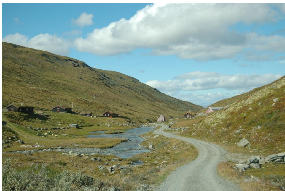
Figur 5.3 Parti fra Vinstradalen som viser seterhusene Ryphusan.

hovedsak lokalisert lenger ned i dalsidene, (se figur 5.3). En finner store områder med ulike velholdte kulturmarktyper 12 i dalen. De varierer fra store områder med gamle slåtteeenger i skog og på elvesletter, til åpne beitemarker og hagemarksskog av bjørk nederst i dalen. På østsiden av elven Vinstra finner en et stort sammenhengende område med åpen beitemark og hagemarksskog. Det er nettopp denne variasjonen av ulike kulturmarktyper og kombinasjon mellom tidligere og dagens bruk av dalen som gjør Vinstradalen spesiell (Liavik, 1996).