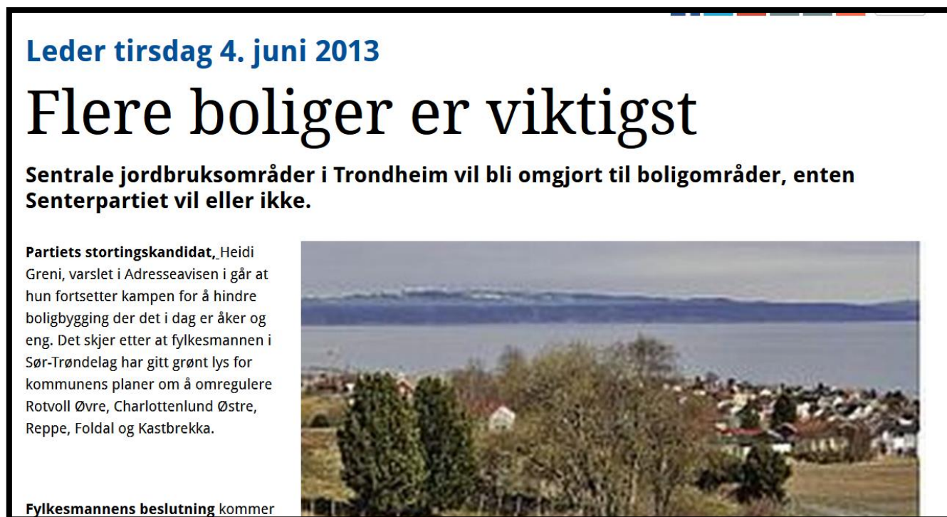
Figur 5: Faksimile Adressa fra 4.06.2013 (Adressa, 2013b)

Ingenting har ennå vært planlagt på området, samtidig som det er snakk om en mulig framtidig omdisponering. Kjernesakene har likevel vært slik som jeg ser det, en kamp om jordvern, arealbruk og tanker om hvordan Trondheim skal se ut. Figur 5-7 viser noen eksempler på medieomtale.