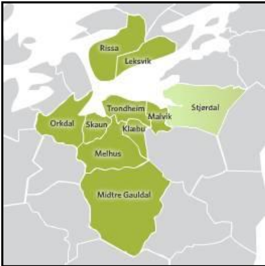
Figur 10: IKAP medlemmer

Området på Øvre Rotvoll har kommet i søkelyset fordi Malvik her la inn innsigelse på bakgrunn av IKAP. Dette området i sammenheng med flere gjorde at Trondheim i alt for stor grad benyttet seg av jordbruksarealer til utbyggingsformål. Malvik mener dette var et brudd med IKAP og at Trondheim ikke tar hensyn til sine dyrkede arealer og jordvernet som helhet (Fylkesmannen i Sør- Trøndelag, 2013).