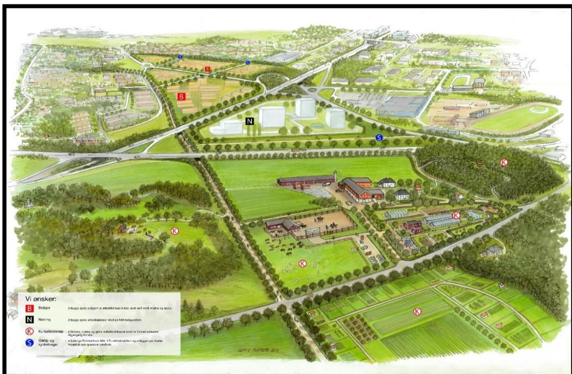
Figur 8: Illustrasjon Øvre Rotvoll med tiltenkt utbyggingsområde og viktige kulturlandskap (Rotvoll Eiendom, 2014b)