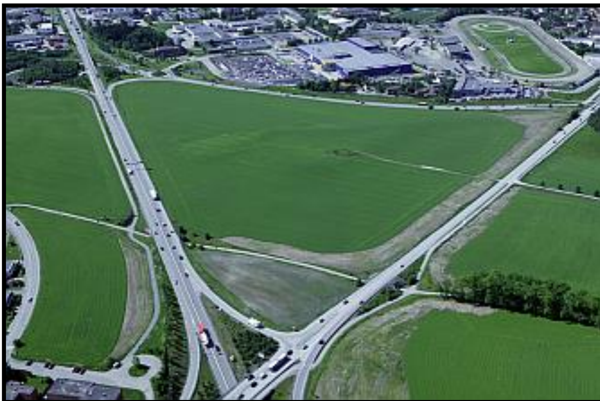
Figur 1: Øvre Rotvoll sett østfra med dyrkamark. Gården til høyre utenfor bildekanten (Rotvoll Eiendom, 2011c)