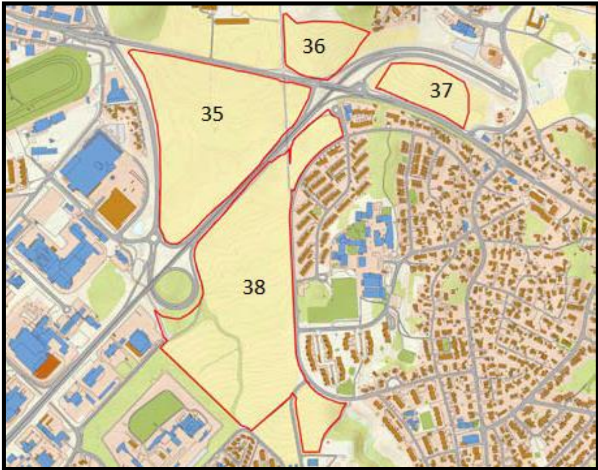
Figur 4: Området inndeling kommuneplanens arealdel. Gårdsbygningene på Øvre Rotvoll ligger helt i overkant av kartet (Trondheim Kommune, 2012c)

Områdene 35, 38 og 37 (se figur 4) er de som er planlagt utbygd, området 37 ble ikke innbefattet i innsigelsen. Område 36 havnet derimot under vern grunnet kulturlandskapshensyn og ligger i sammenheng med St. Hanshaugen, Schmettows allé og gårdsbygningene. Område 35 er omtalt som trekanten og er på ca. 145 daa, område 38 sør for omkjøringsveien er på ca. 205 daa, område 37, svenskjordet øst , er på ca. 30 daa.