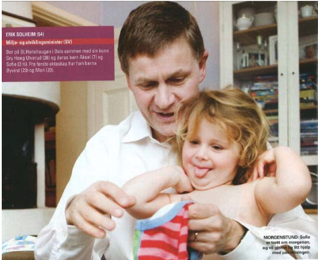
ERIK SOLHEIM (54)