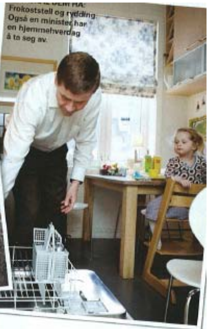
FROKOSTSTELL OG RYDNING. Også en minister har en hjemmehverdag å ta seg av.