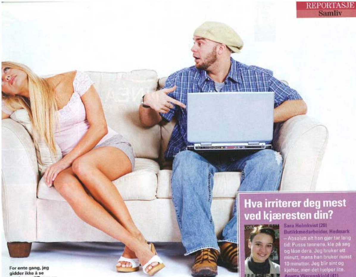
For ente gang, jeg gidder ikke å se scoringen til Torres en gang til på YouTube.