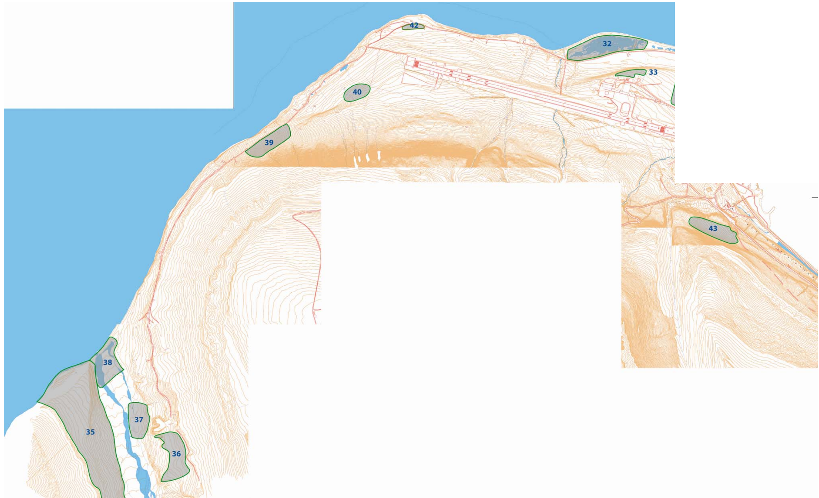
Vedlegg III: Kart over lokalitetene i vestlig område (Hotellneset, flyplassen, Bjørndalen)