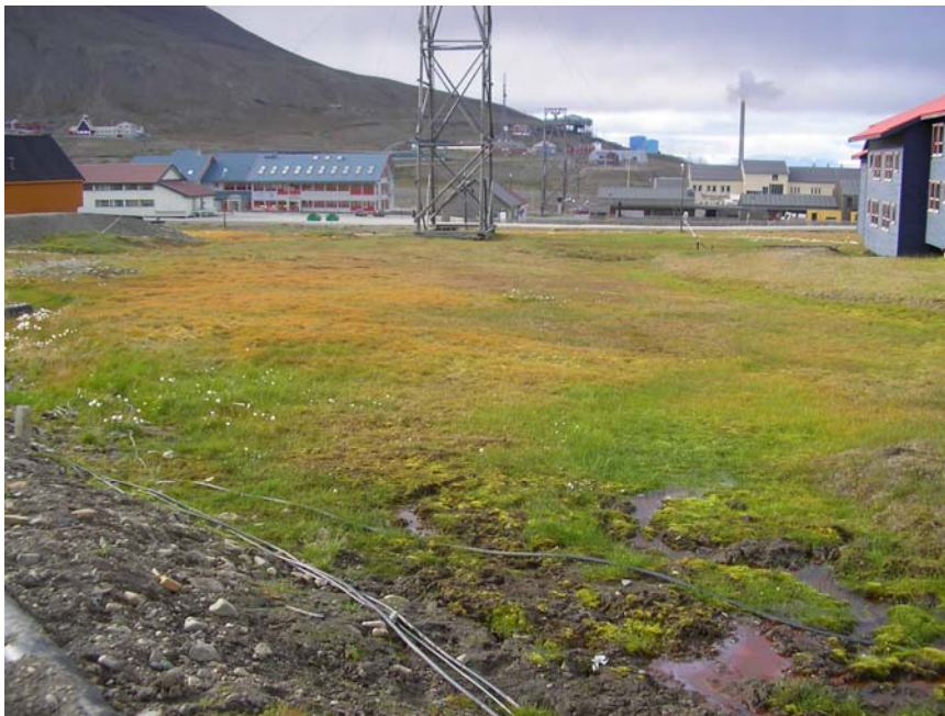
Lokalitet 23: Våtmark i sentrumsfeltet ved taubanebukken (se også framsidebildet på rapporten).

Verdiklasse: Forekomsten av rødlistearter i en vegetasjonstype som er sjelden i denne delen av planområdet gjør at lokaliteten plasseres i verdiklasse 1. I tillegg kommer verdier knyttet til identitet, landskap og kulturminner.