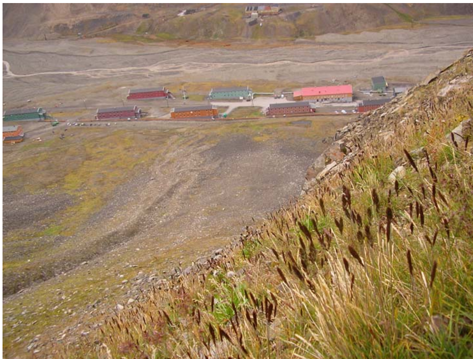
Forholdet mellom natur og bebyggelse er en viktig del av Longyearbyens identitet og estetiske verdi, som her i Nybyen.

Sentrumsområdet i Longyearbyen er lite og har en tett bebyggelse, spesielt i nedre del. Åpninger som gir utsyn eller kontrast mot bebyggelsen er en del av det estetiske inntrykket. I Longyearbyen representerer slike åpne landskap samtidig lommer med biologisk mangfold, og til sammen utgjør dette sentrale elementer i bybildet.