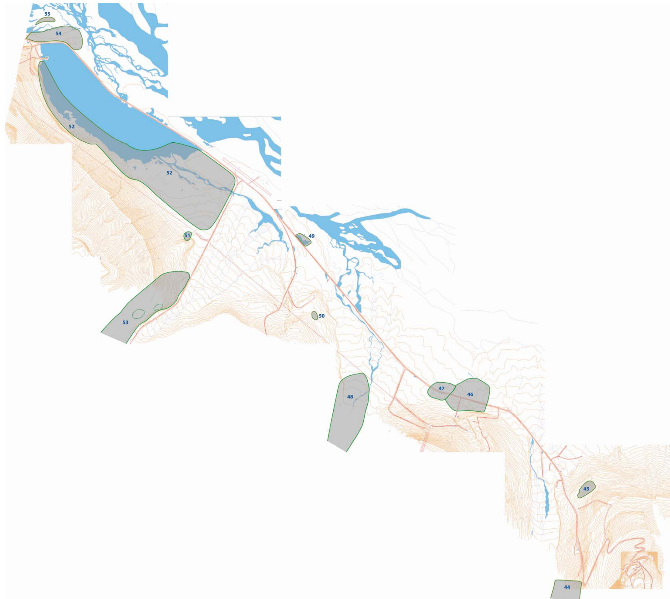
Vedlegg IV: Kart over lokalitetene i østlig område (Adventdalen)