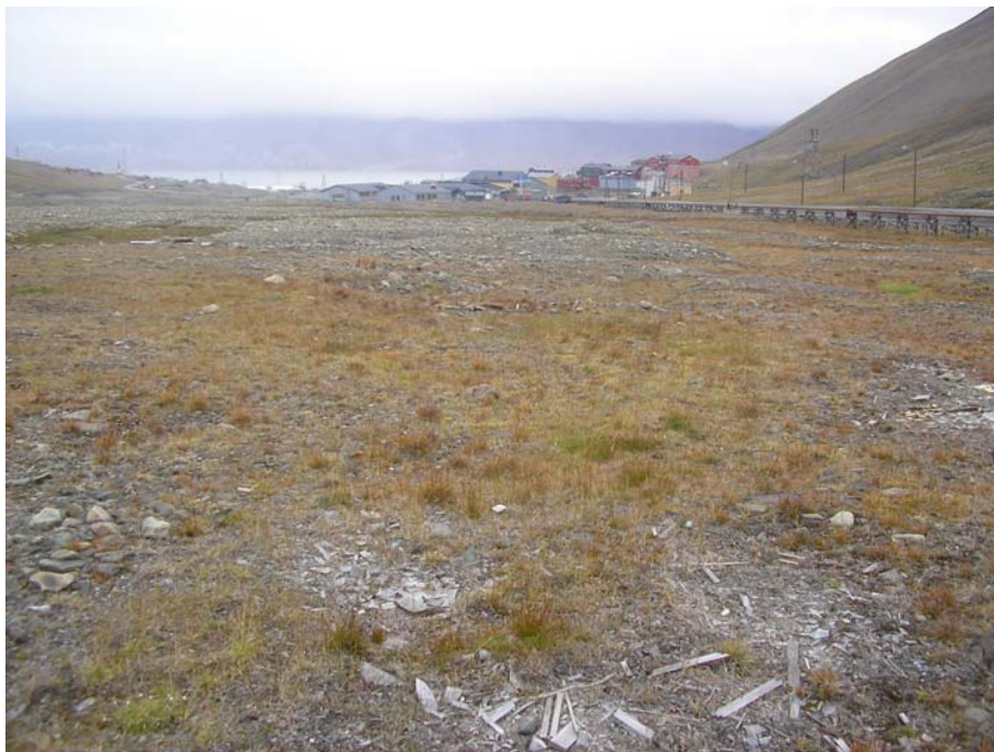
Lokalitet 29: Mellom skolen og Nybyen (vestsida av vegen).

Verdiklasse: Lokaliteten representerer ikke spesielle verdier for biologisk mangfold i planområdet og plasseres i verdiklasse 4.