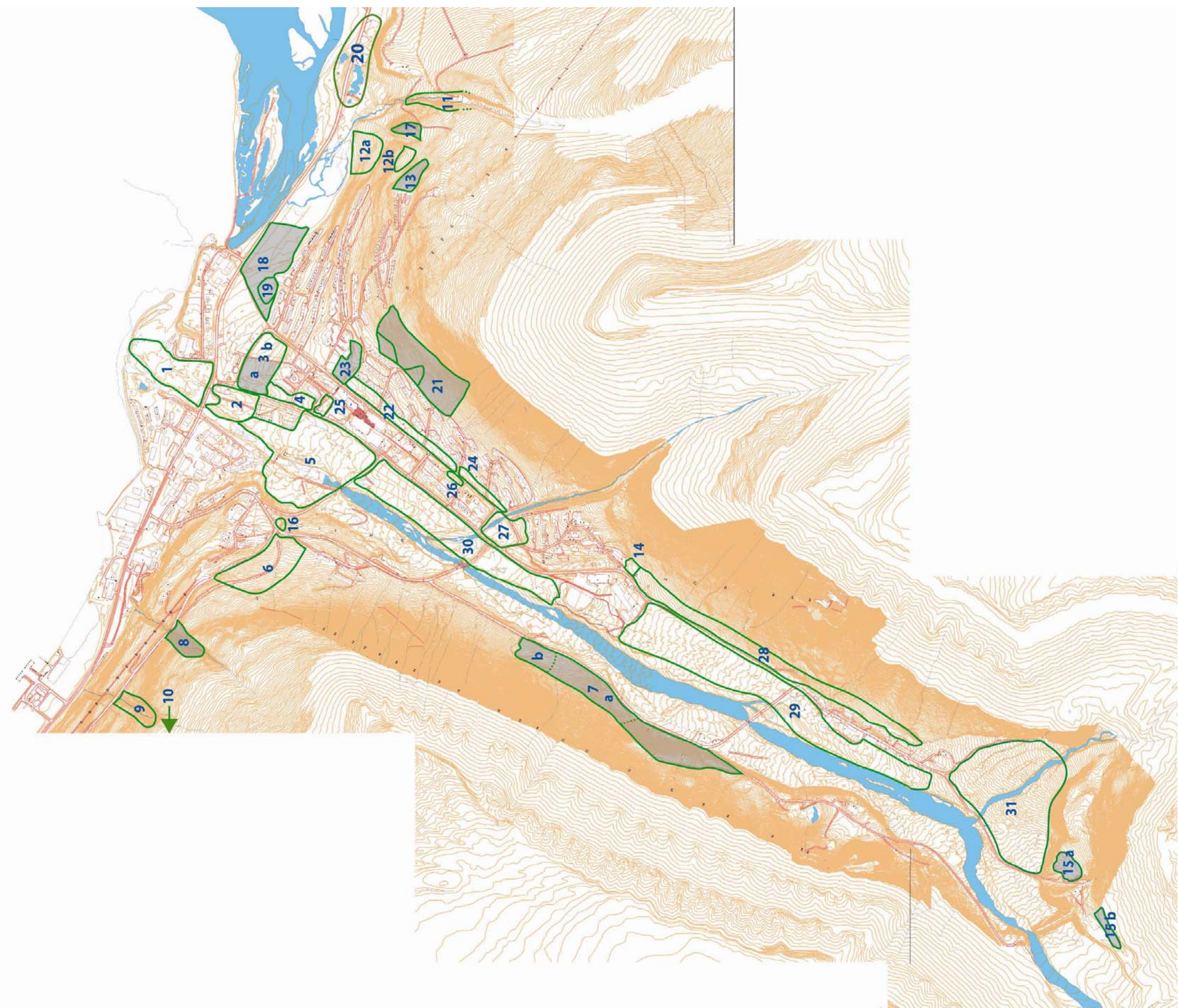
Vedlegg II: Kart over lokalitetene i Longyeardalen (Delplan Longyearbyen tettsted)