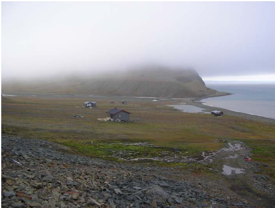
Lokalitet 38: Elveutløpet og ytre deltaområdet i Bjørndalen. (Lokalitet 35 i bakgrunnen).