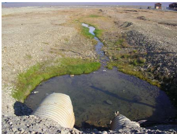
Lokalitet 1: Utløpet av Longyearelva ved sjøskrenten.

Verdiklasse: Ut fra rent biologiske vurderinger setter lokaliteten til klasse 3. Lokaliteten representerer imidlertid en tilleggsverdi fordi den er det siste (mer eller mindre) intakte kontaktpunktet mellom Longyearelva og fjorden.