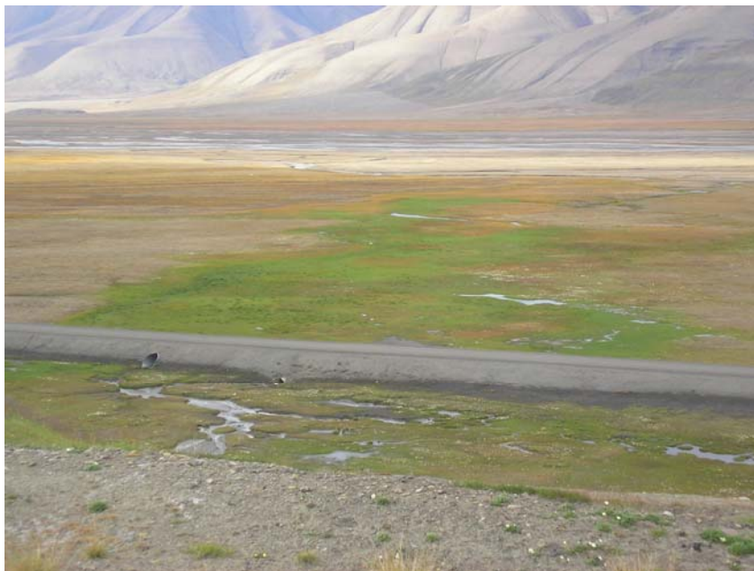
Lokalitet 46 og 47. Langs vegen innover Adventdalen nedenfor Gruve 6.