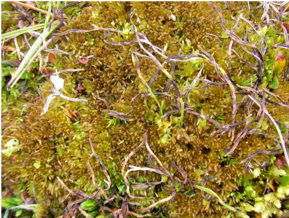
Torvmoser er sjeldne på Svalbard, men har noen gode forekomster i planområdet. Bildet viser polartorvmose (Sphagnum arcticum).

Torvmoser er sjeldne på Svalbard og derfor er to våtmarksområder med torvmosevegetasjon oppe ved den gamle hundegården øverst i Longyeardalen vurdert til verdiklasse 2 (lokalitet 15).