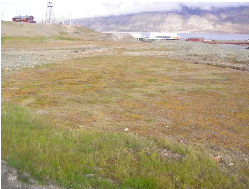
Lokalitet 5: Elvesletta vest for Sentrumsfeltet.

Verdiklasse: Ut fra vurdering av biologiske verdier og status plasseres lokaliteten i verdiklasse 4.