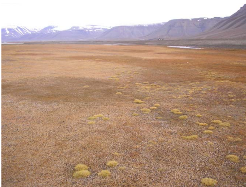
Strandeng i Adventdalen. Det brune inntrykket er teppesaltgras og ishavsstjerneblom, mens de tydelige tuene er isbjørnstarr.

Verdiklasse: Lokaliteten er viktig for biologisk mangfold og plasseres i verdiklasse 2. I tillegg har den opplevelses- og pedagogisk verdi ettersom den ligger lett tilgjengelig fra byen.