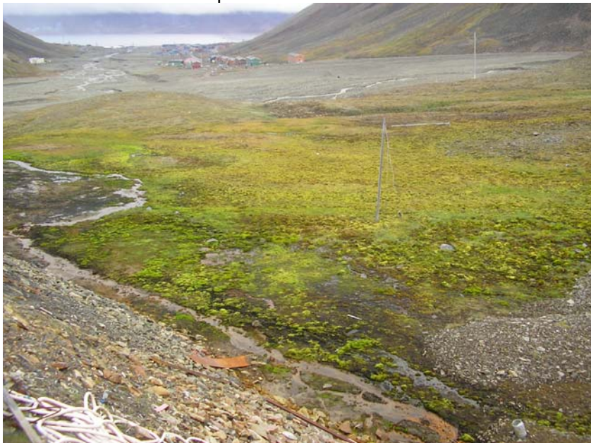
Lokalitet 15a: Øverst i Longyeardalen (under Gruve 4), ved den gamle hundegården.

Verdiklasse: Lokaliteten plasseres i verdiklasse 2.