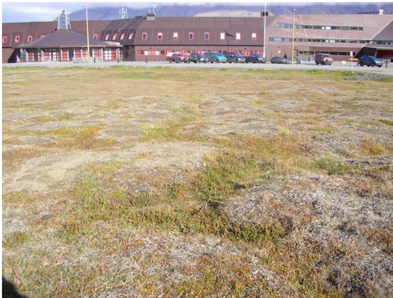
Lokalitet 3a: Mellom UNIS og Polarhotellet (vest for gangsti).

Verdiklasse: Lokaliteten er viktig for biologisk mangfold i planområdet og føres til verdiklasse 2. Lokalitetens viktighet for landskapsbildet i denne delen av byen forsterker verdien ytterligere.