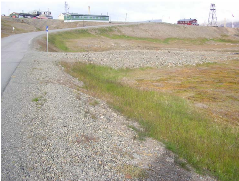
Vegkanter tilsådd med kommersielle grasfrøblandinger i 1998, i regi av prosjektet "Longyearbyen grønnere". Bildet er tatt i 2006.

Det finnes flere eksempler på plantearter og noen dyrearter som utilsiktet har kommet til Svalbard med mennesker eller dyr (Elvebakk & Prestrud 1996, Hagen 2001). Noen plantearter har etablert seg med stabile populasjoner i planområdet, som vanlig rødsvingel, sølvbunke og ryllik (Rønning 1996). Østmarkmusa er eksempel på en pattedyrart som har blitt innført til Svalbard gjennom skipstransport. Allerede på 1800 tallet ble det rapportert om funn av fremmede arter på Svalbard. I 1941 ble det rapportert ei liste på 52 fremmede plantearter (Hadač 1941).