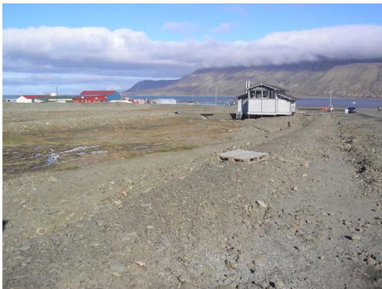
Lokalitet 2: Sør for "Fjernvarmesentralen" (Elvesletta nord).

Verdiklasse: Ut fra samlet vurdering av verdier og tilstand plasseres lokaliteten i verdiklasse 4.