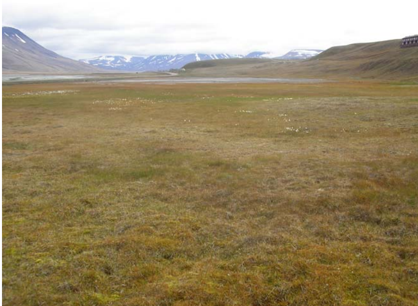
Lokalitet 18: Våtmark/strandeng øst for UNIS (mellom vegen og bebyggelsen).

Verdiklasse: Forekomsten av rødlista art indikerer høy verdi for biologisk mangfold, men verdien er noe redusert ettersom lokaliteten er modifisert av endret dreneringsmønster. De delene av lokaliteten der rødlisteartene vokser (lokalitet 19) tilhører verdiklasse 2. Resten av lokaliteten kan settes som verdiklasse 3, men samtidig kan opprettholdelsen av rødlistearten være avhengig av at hele lokalitet 18 bevares.