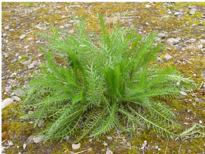
Ved lokalitet 15 finnes det noen store og veletablerte tuer av ryllik, som er en introdusert art på Svalbard.