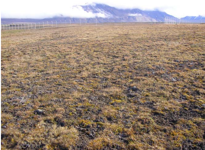
Lokalitet 40: Vest for enden av flystripa.