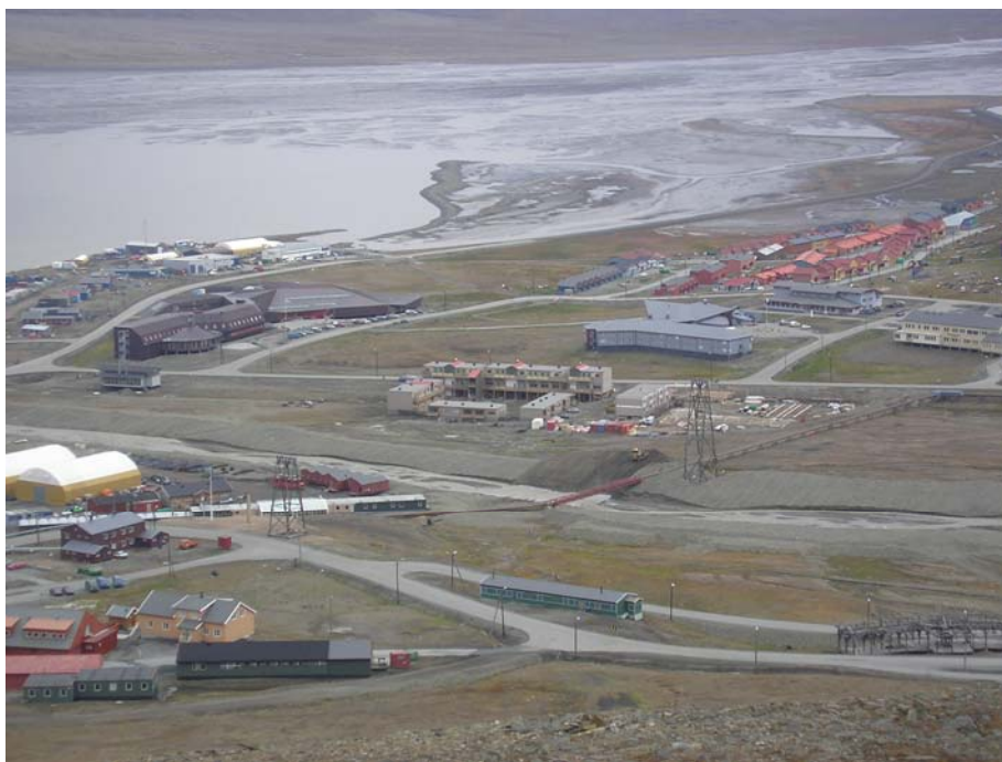
Nedre del av Longyeardalen er bebygd i løpet av de siste par tiårene med boliger, offentlige bygg og bygg som huser privat næringsliv.

Sentralt i planområdet ligger Longyeardalen med Longyearbyen. Dette er et pressområde med ønske om fortetting og nyetablering av boliger og andre tettstedsfunksjoner. Eksisterende arealplan har derfor en egen "Delplan Longyearbyen tettsted".