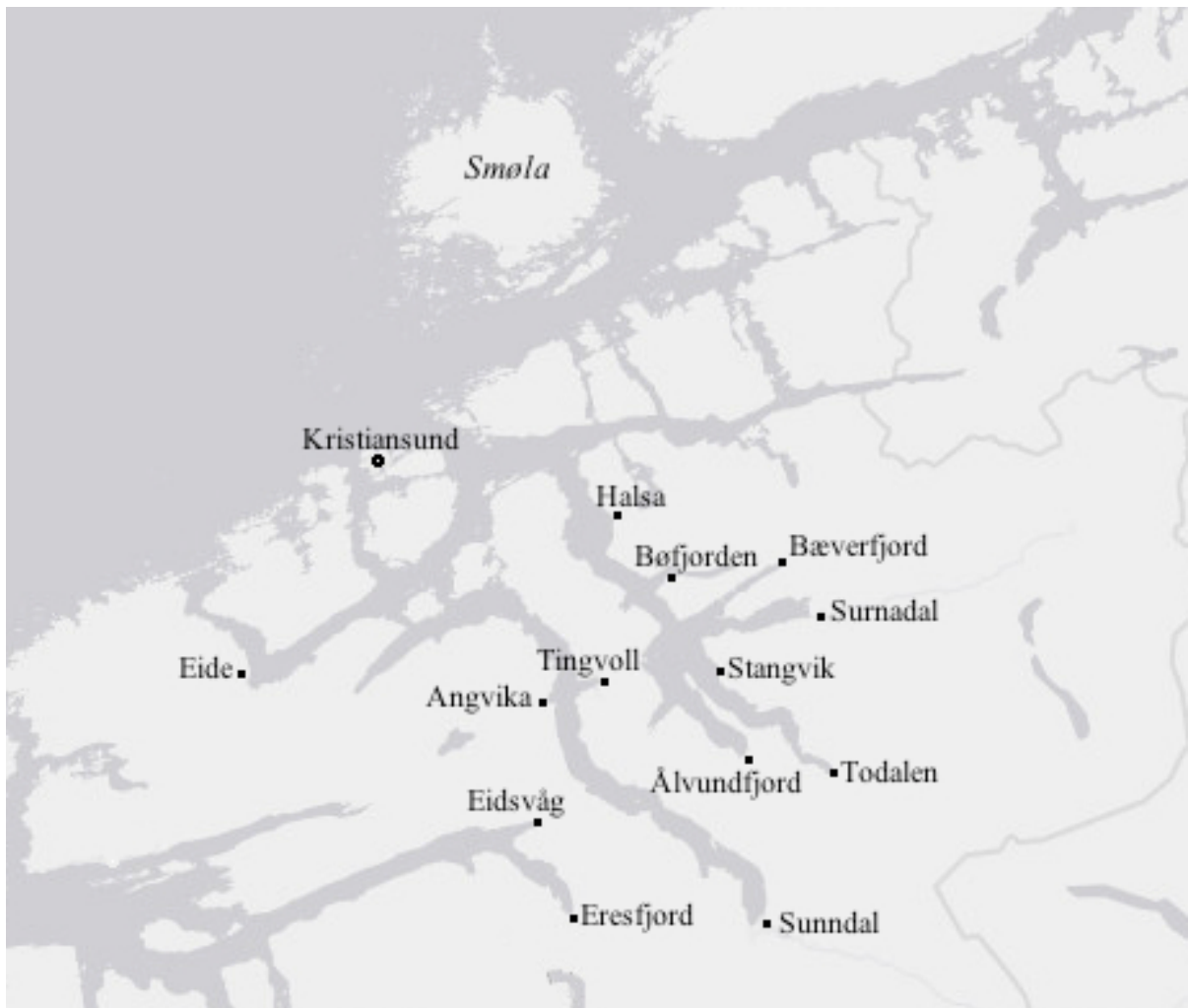
Kart 2: Nordmøre.