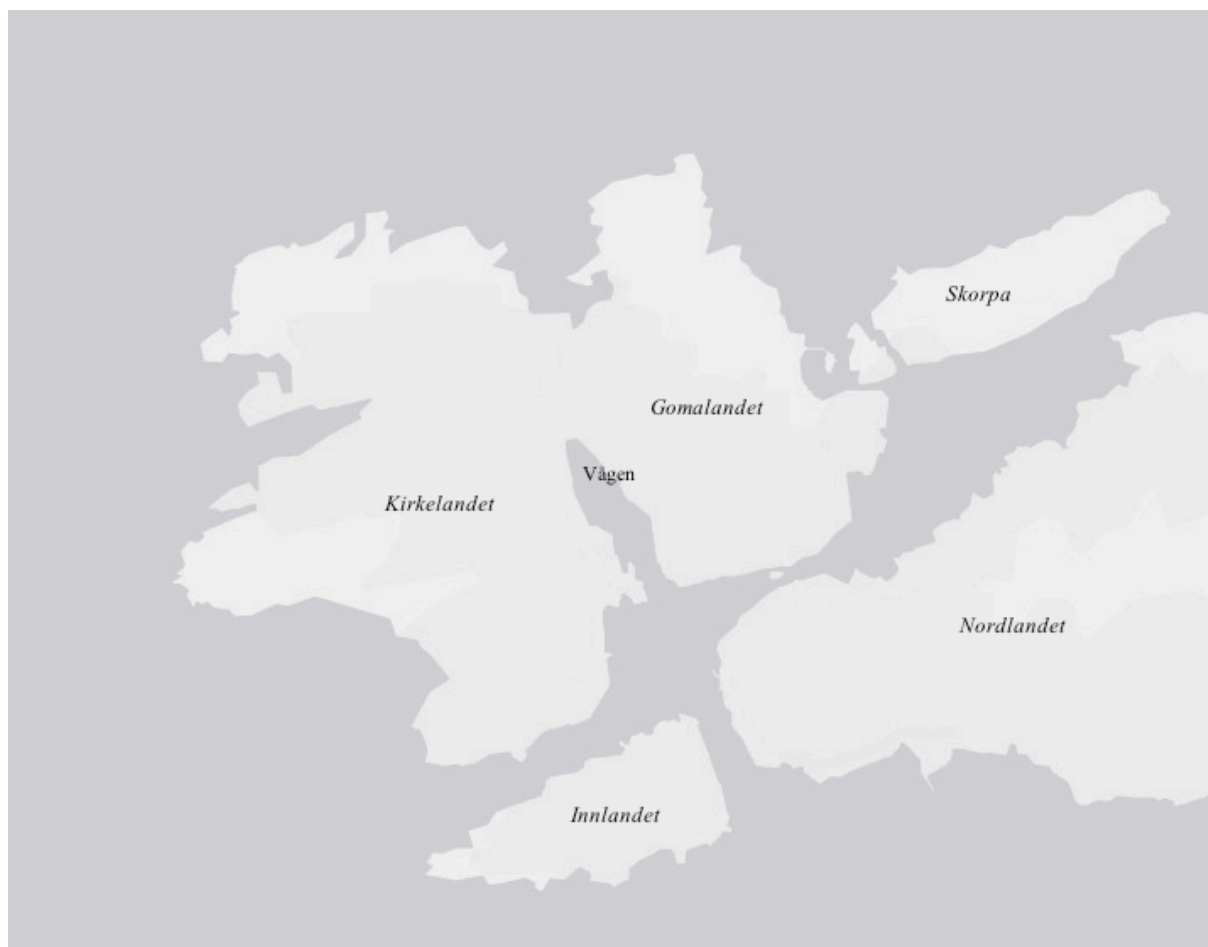
Kart 1: Kristiansund.