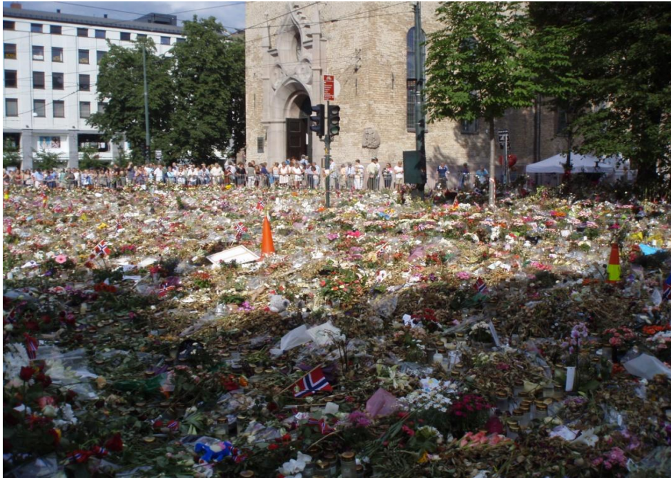
Figur 1: Utenfor Oslo domkirke, 31. juli, 2013.