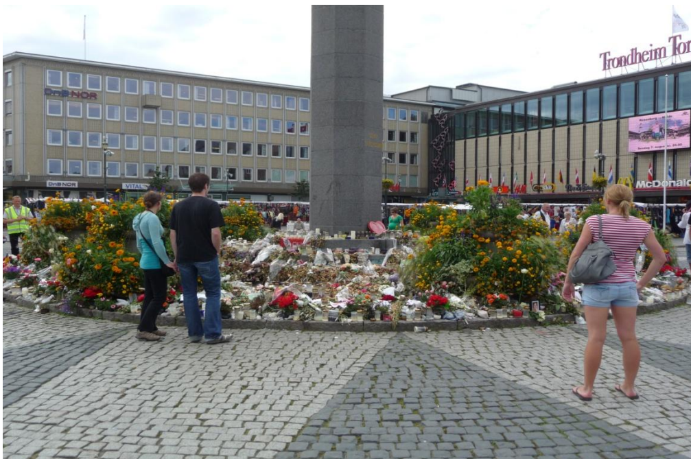
Figur 2: Før... Fra Trondheim Torg, 5. august, 2011.