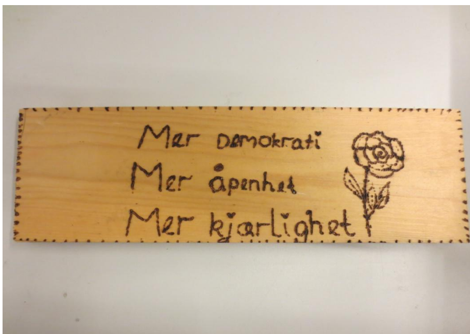
Figur 4: Fra Wa L0007, Trondheim Torg, innhentet 5.8.2011. A-5246 Minnemateriale etter 22.7.2011.