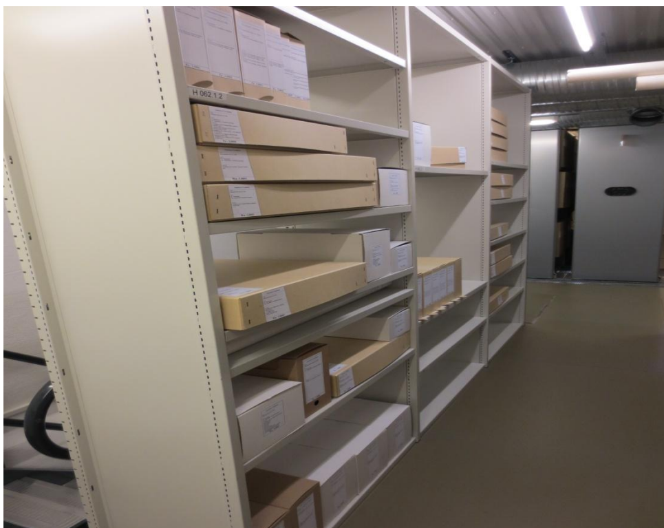
Figur 3: og etter... Fra magasinet på Arkivsenteret, Trondheim.