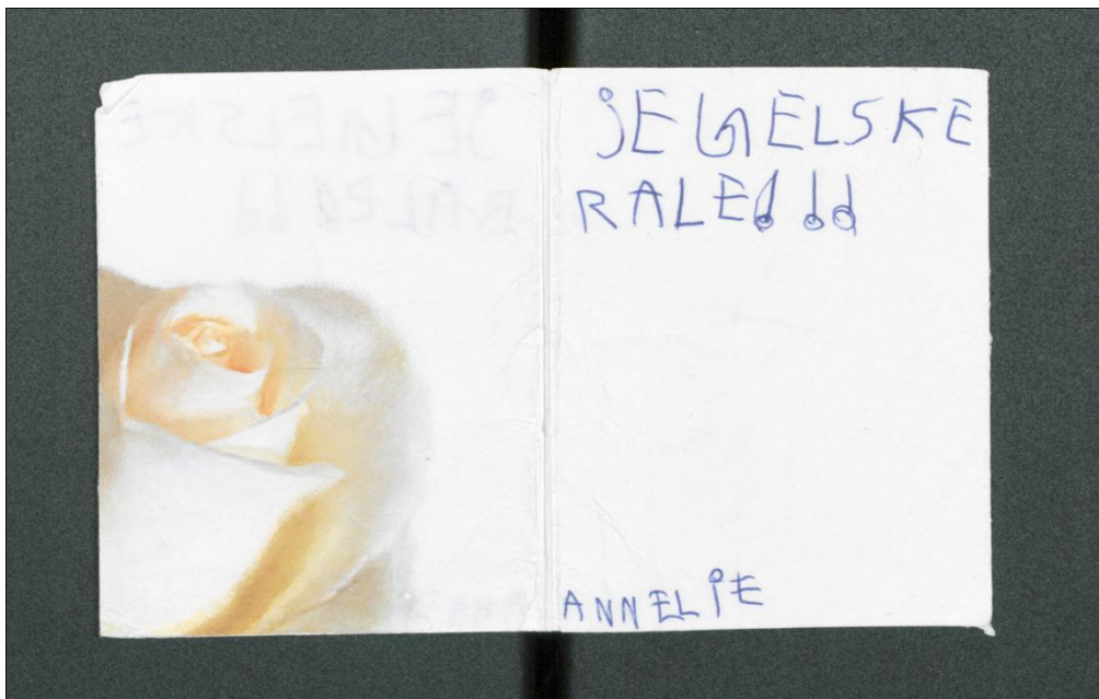
Figur 6: Fra Fa L0001, Trondheim Torg, Munkegata, innhentet 5.8.2011. SAT