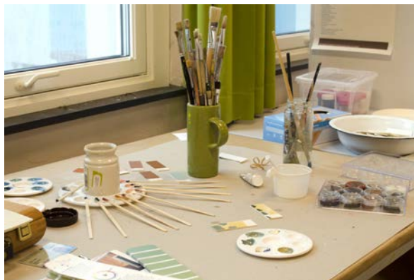
Prosess med utarbeidelse av fargeprøver

avviker noe fra det gitte utgangspunktet, at materialet er såpass omfattende at det allikevel kan gi en valgfrihet innenfor et historisk rammeverk, som var målsetningen med oppgaven i utgangspunktet.