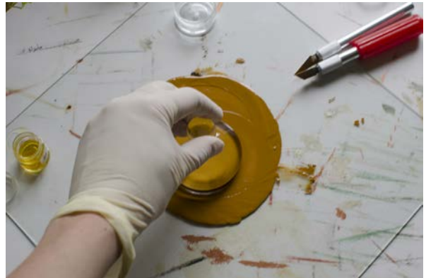
Prosess med riving av oker tørrpigment i rå linolje med glassløper på glassplate.

Jeg måtte på ta den kanskje vanskeligste beslutningen for meg i løpet av prosessen, og bestemme meg for å ikke gjengi fareprøvene i eksakt mål. Jeg bestemte meg i utgangspunktet også for å heller gjøre oppstrøkene med kunstnerfarger fra tube og beskrive fargene ved hjelp av pigmenter i fargeblandingen og NCS-koder foran nøyaktige måleenheter. Dette viste seg også å være en vanskelig løsning, da pigmentene i kunstnerfargene var alt for rene, og gav ikke i nærheten av det samme farger resultatet som det naturlige tørrpigmentene jeg hadde startet med. Et kompromiss ble til slutt å rive egne tørrpigmenter i rå linolje og lage egen pasta, men å kutte ut måleenhetene på de enkelte pigmentene i fargeprøvene.