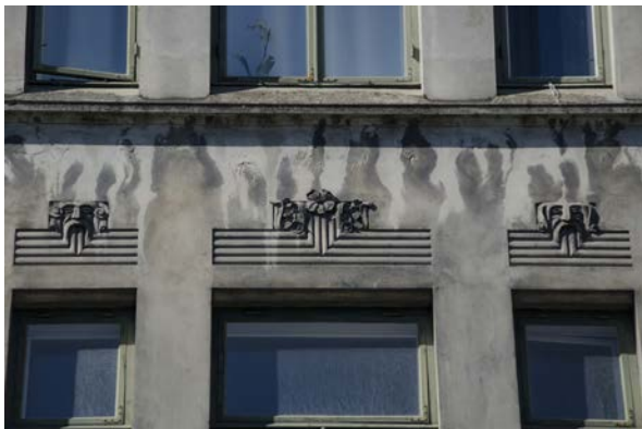
Eget foto av Osloveien 4-6, Trondheim. Detalj over vinduer.

En utfordring i prosessen har vært å få tak i tilstrekkelig bildemateriale til boken. Jeg hadde en del egne foto, og i tillegg har jeg fått tatt en god del foto som har vært nødvendig for å formidle innholdet i boken. En begrensning ble at på alle bildene jeg fikk tatt dette semesteret måtte taes i Trondheim da jeg verken hadde økonomi eller mulighet til å reise rundt for å ta bilder. Dette gjør at de fleste bildene som skal representere epokene er hentet fra Trondheim.