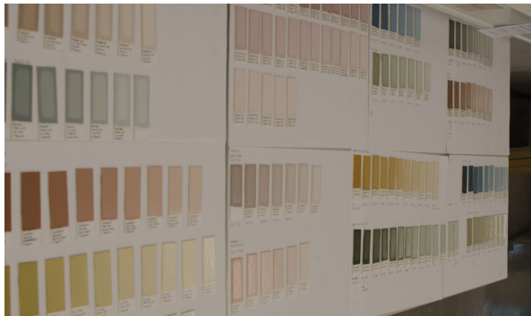
Oppstrøk av fargeprøver til tørk.

Jeg ser i retrospekt at utgangspunktet for oppstrøkene var litt i overkant vanskelig. Jeg benyttet meg av NCS-koder hentet av andre, som jeg igjen prøvde å gjenskape. Da NCS-koder i utgangspunktet er unøyaktige når vi snakker om historiske farger, var det svært vanskelig å gjenskape fargene med nøyaktighet. Den erfaringen jeg hadde med fargeblanding fra tidligere, var farger jeg selv hadde hentet fra historiske bygninger som jeg gjenskapte, og jeg hadde da mulighet til å sjekke fargeprøvene mot originalfargen. Nå hadde jeg kun en NCS-kode som utgangspunkt, noe jeg i ettertid vil si var uheldig med tanke på mulighet til å etterprøve de fargene jeg kom frem til. Allikevel var dette eneste måte for meg å gjøre materialet overkommelig på innenfor den tiden jeg hadde til rådighet, og jeg ser ingen annen måte jeg kunne gjort dette på. Alt i alt er jeg fornøyd med at selv om resultatet i form av mine fargepaletter