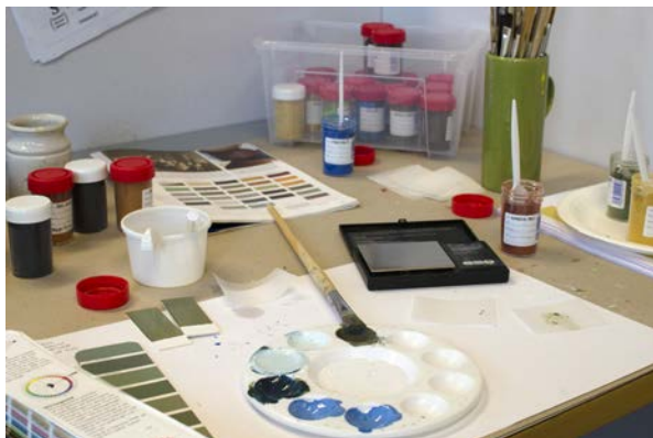
Oppmåling av tørrpigment med gramvekt for nøyaktig blanding av farger

Skriver liste for hva jeg må ta med for å begynne på fargeprøvene nå. Kjenner jeg får litt panikk. Det blir skumle greier. Jeg må huske å også ta bilder. Alle fargeprøvene må også fraktes hjem igjen for å scannes. Det må gjøres hjemme. Dette er den siste store etappen. Om jeg klarer å bli ferdig på disse tre ukene, så er jeg liksom i rute, og det hadde vært veldig deilig. Jeg skal få det til altså! Jeg må bare manne meg opp på ett eller annet vis. Kjenner allikevel at jeg gleder meg til fargeprøvene. Det er liksom siste "uoverkommelige" epoke. Så når jeg omsider har det klart, kan jeg konsentrere meg om bare tekst!