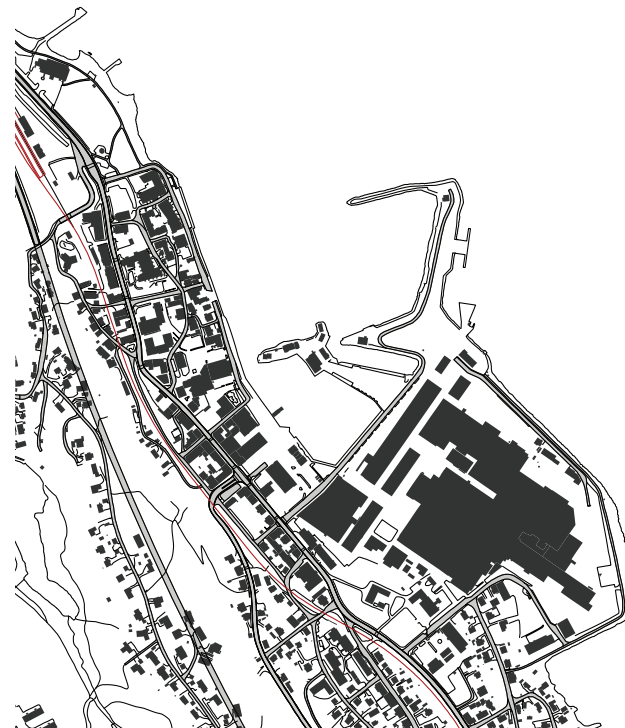
Sentrum i Holmestrand, ved fjorden nedenfor fjellet.