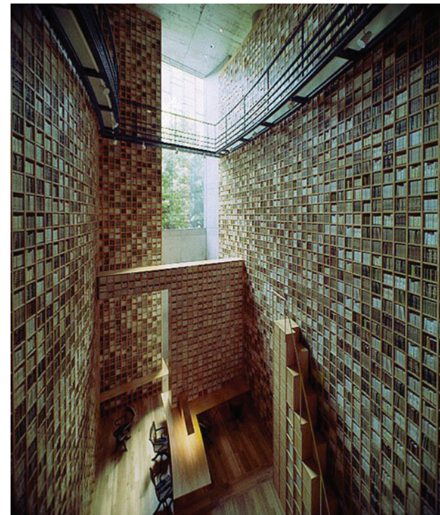
Shiba Ryotaro Memorial Museum i Osaka, Japan (Tadao Ando, 2001) er et bibliotek og museum viet til den japanske forfatteren av samme navn.