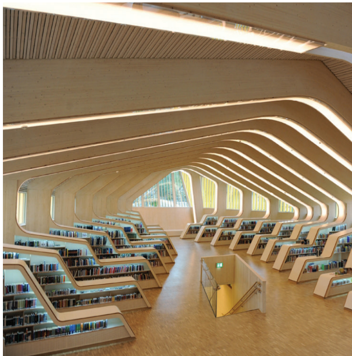
Biblioteket i Vennesla kulturhus (Helen og Hard, 2011).