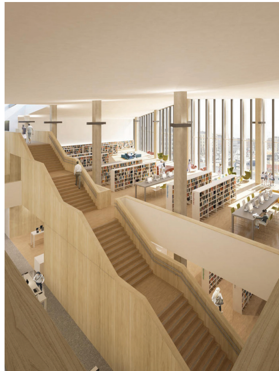
Stormen kulturkvartal i Bodø (Rosbottom og Howarth) tilbyr både bibliotek, theater og konserthus. Avbildet: Biblioteket.