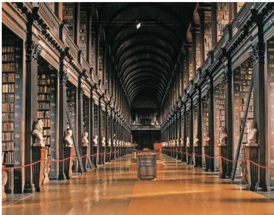
Trinity College Library i Dublin — her hever man ikke stemmen.