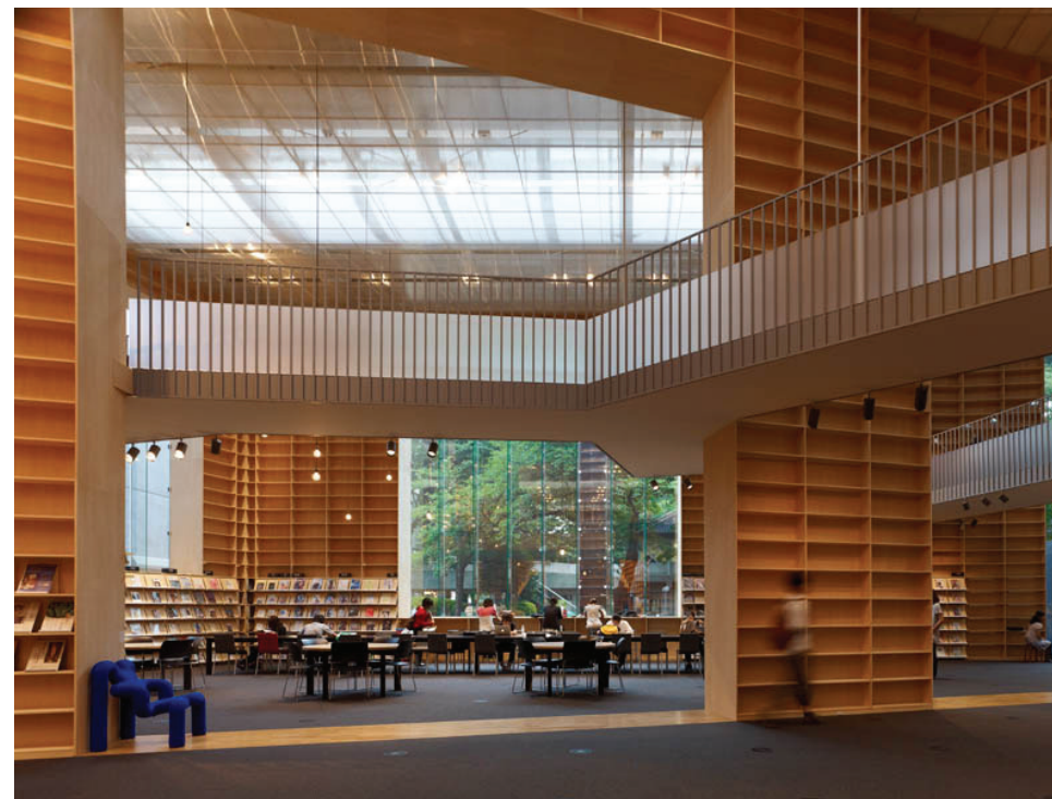
Musashino Art University Library (Sou Fujimoto, 2010) er designet for å tilrettelegge for møter mellom personer.