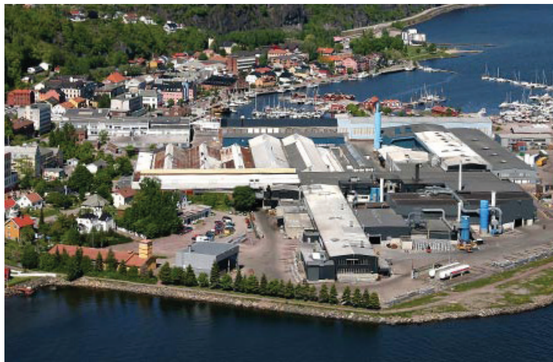
Norsk Hydros aluminiumfabrikk sør for sentrum utgjør en drastisk endring i skalaen på bebyggelsen i Holmestrand. Den danner den sørvende horisonten fra sentrum.