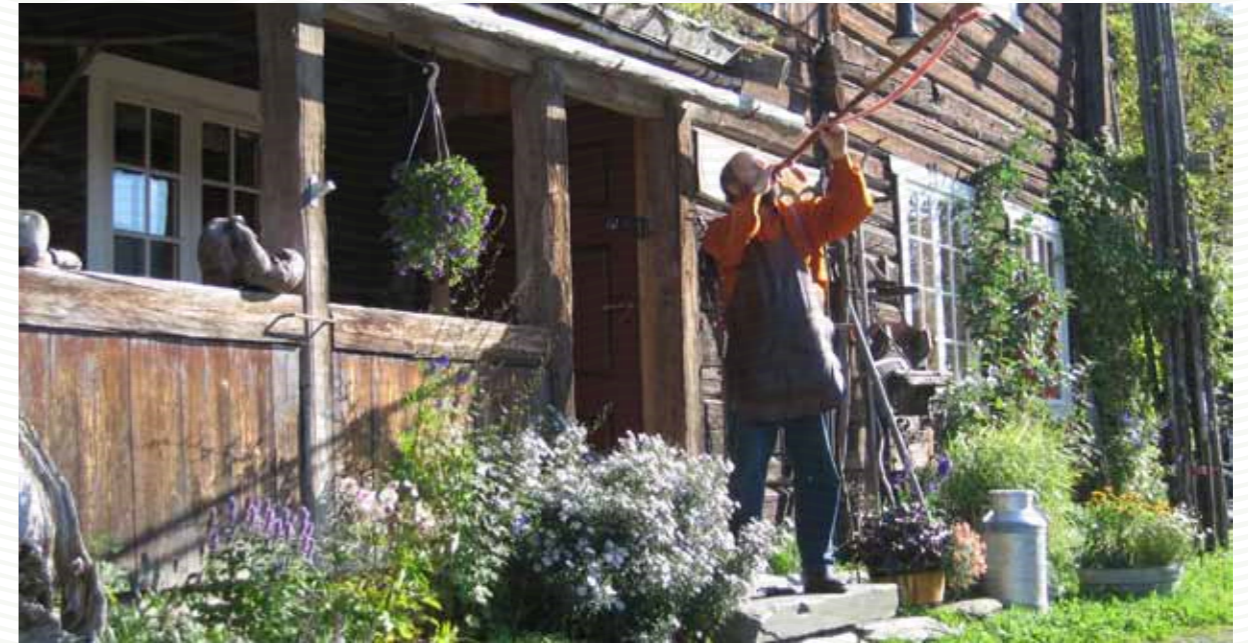
Kulturstua i Ro

Naturbaserte reiselivs- og opplevelsesnæringer antas å ha et stort utviklingspotensial i Bygde-Norge. For mange landbrukshushold vil utvikling av nye næringsområder med utgangspunkt i gårdsressursene være viktig for deres nærings-