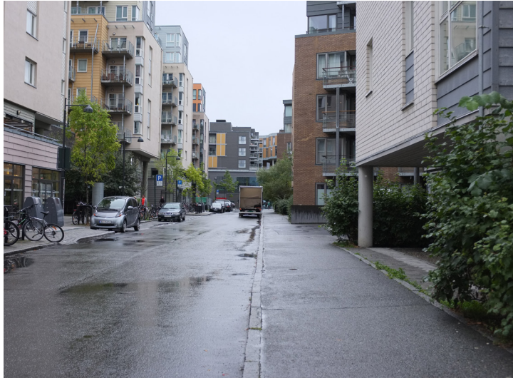
Dyre Halsesgate, Nedre Elvehavn ved Solsiden i Trondheim.