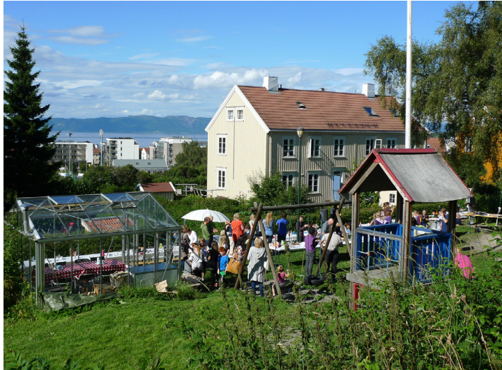
Sosial ettermiddag i Trondheim Kooperative Boligselskap Borettslag (TKB) på Rosenborg i Trondheim.