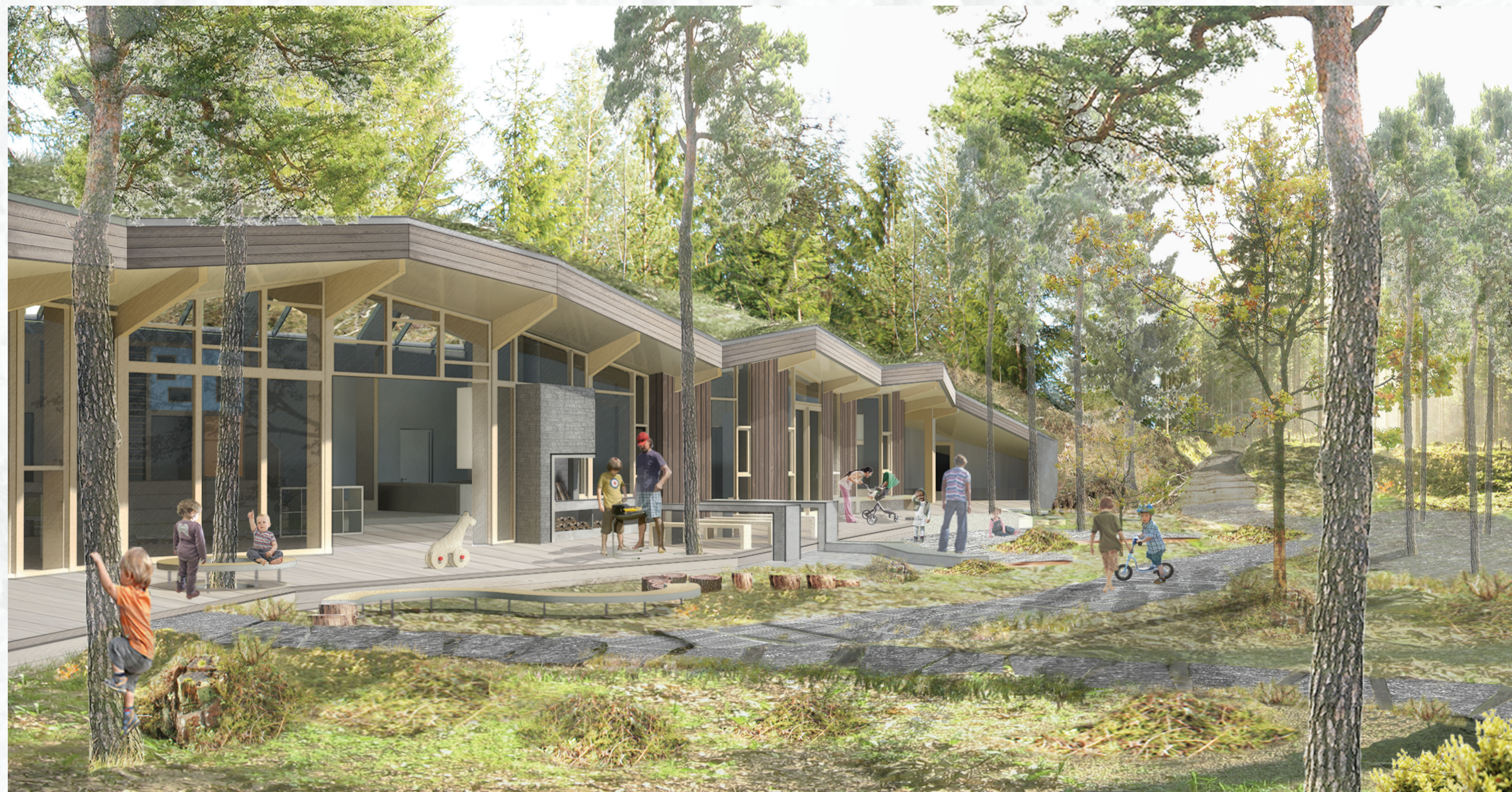
Eksteriørperspektiv - sett fra sørvest

Barnehagen i skogen er en krysning av en naturbarnehage og en aktivitetsbarnehage, men har en fast base for de minste barna. Fra mitt ståsted er det imidlertid mindre viktig at barnehagen gis en klar typologi. Elementer fra ulike tradisjoner er hentet for å gi barna best mulig rammer for friere bevegelse og valgfrihet, samt ivareta behovet for trygghet for de minste barna.