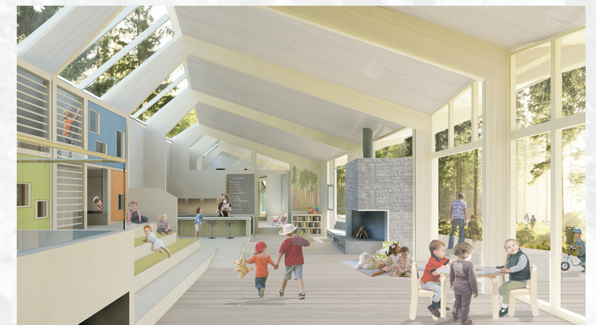
Interiørperspektiv - hjemmebasen