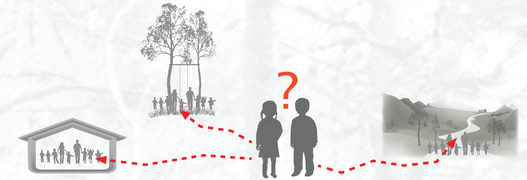
Barna gis så langt det er mulig valg om de ønsker å være i gruppene som driver med aktiviteter innendørs, i nærområdet eller som skal på utfarter

Barna leveres i hjemmebasen. Her kan de ha en felles samlingsstund og havregrøten serveres fra kjøkkensonen. Barna deles etter hvert inn i de ulike aktivitetsgruppene. En gruppe skal kanskje utforske nærområdet og lete etter materiale til sine kunstverk som de senere skal foredle i trehytten. En annen gruppe skal utforske et av de nærliggende naturområdene, for eksempel langvannet, hvor en lav og bålplate kan etableres. En tredje gruppe skal hovedsakelig være i hjemmebasen. Barna velger hvilken gruppe de vil være i. På slutten av dagen samles barna igjen i hjemmebasen hvor de leker og utveksler dagens begivenheter.