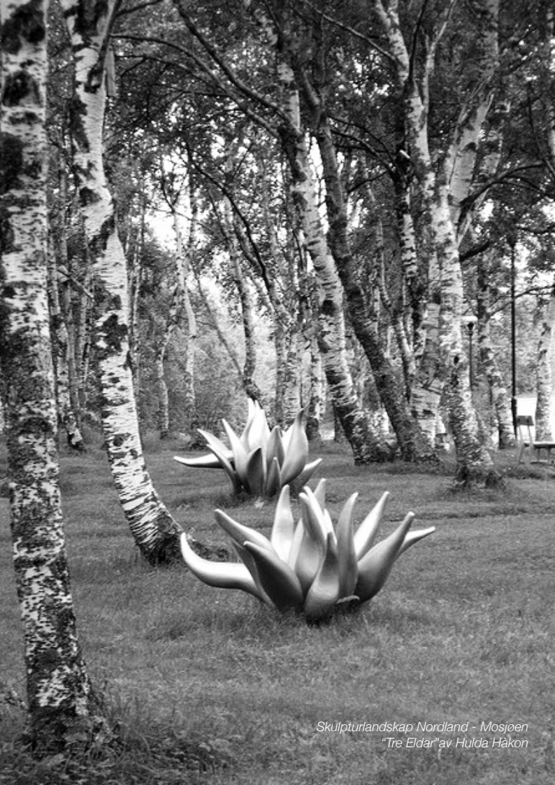
Skulpturlandskap Nordland - Mosjøen "Tre Eldar" av Hulda Håkon