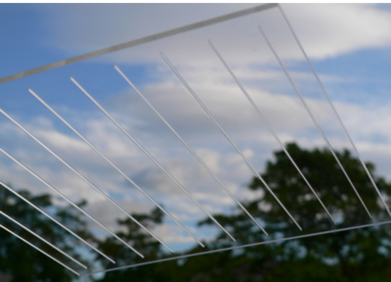
Deamp panelabsorbent www.deamp.no