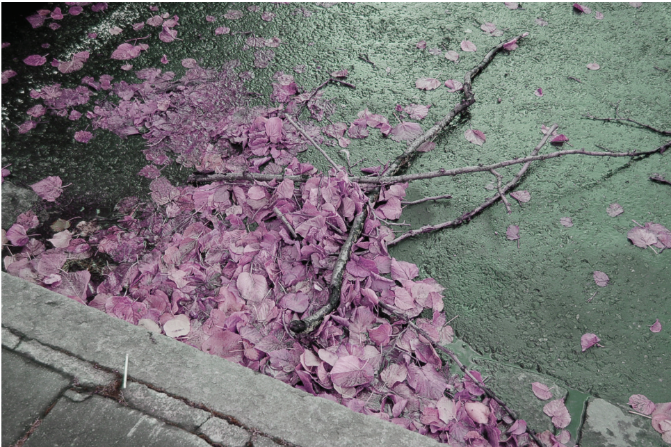
| Fortauskant med høstløv