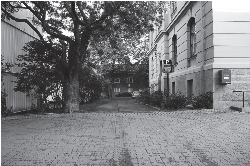
Rådhusets parkering | øst