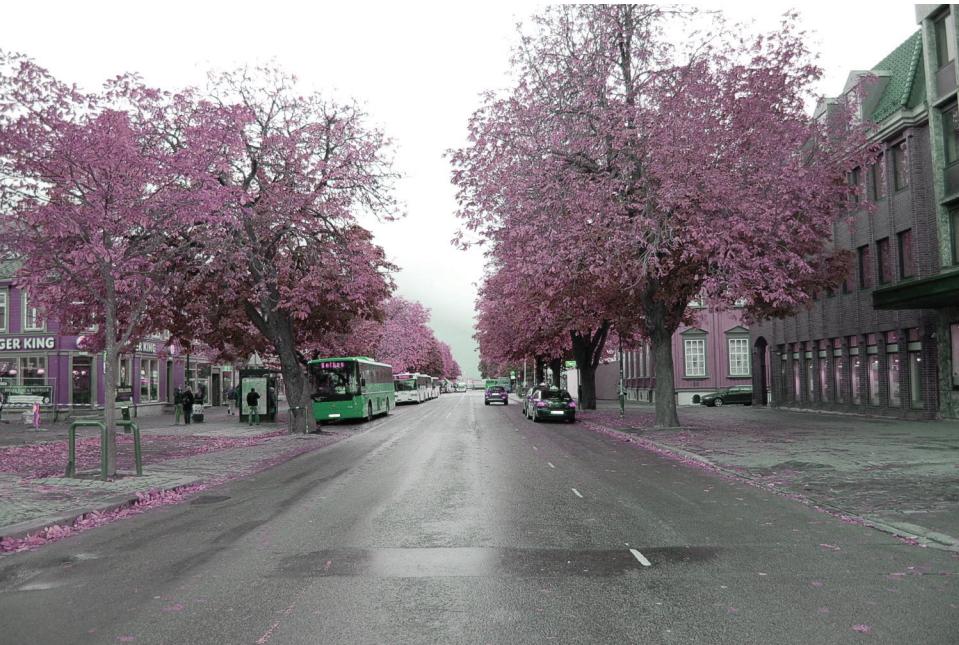
Dronningens gate | s ø r