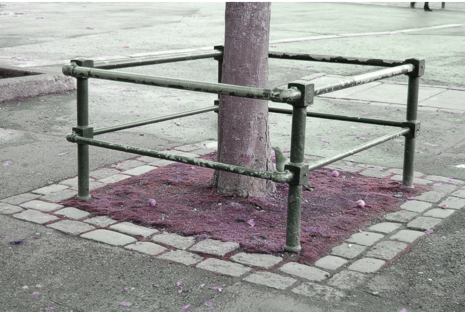
Dekorasjon rundt tre |