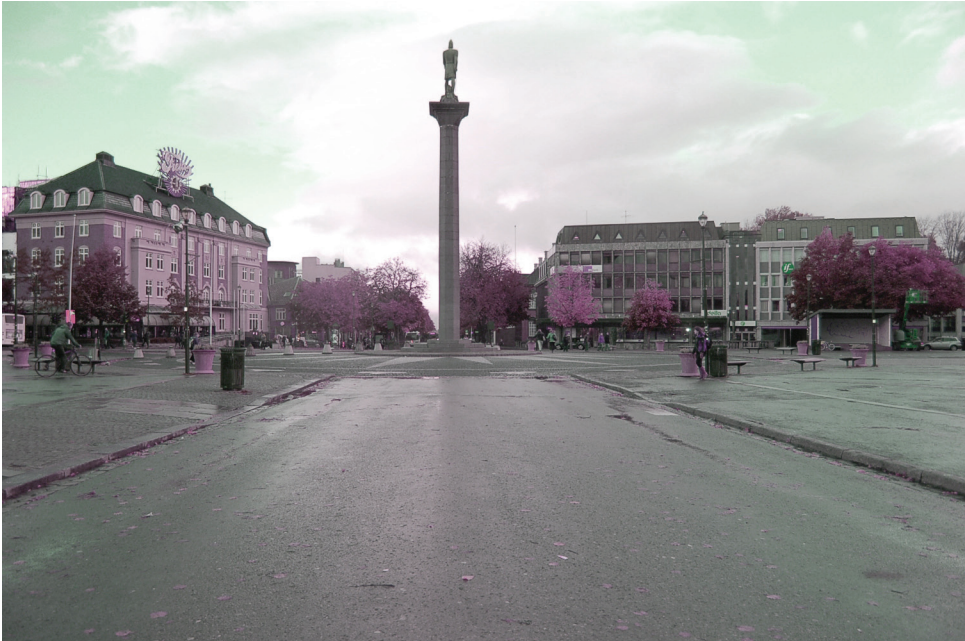
torvet, Kongens gate | nord