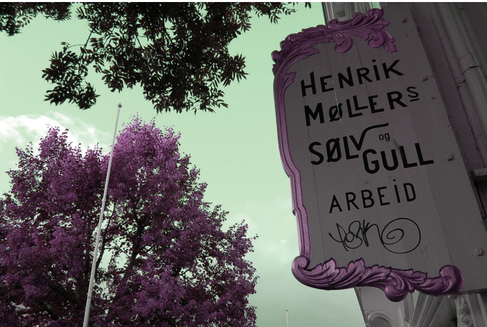
Skilt Gullsmed i øvre del av Munkegata |