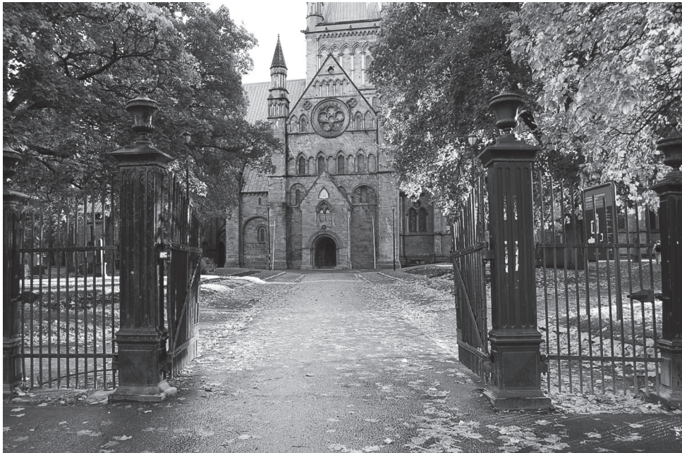
Nidarosdomen | s ø r