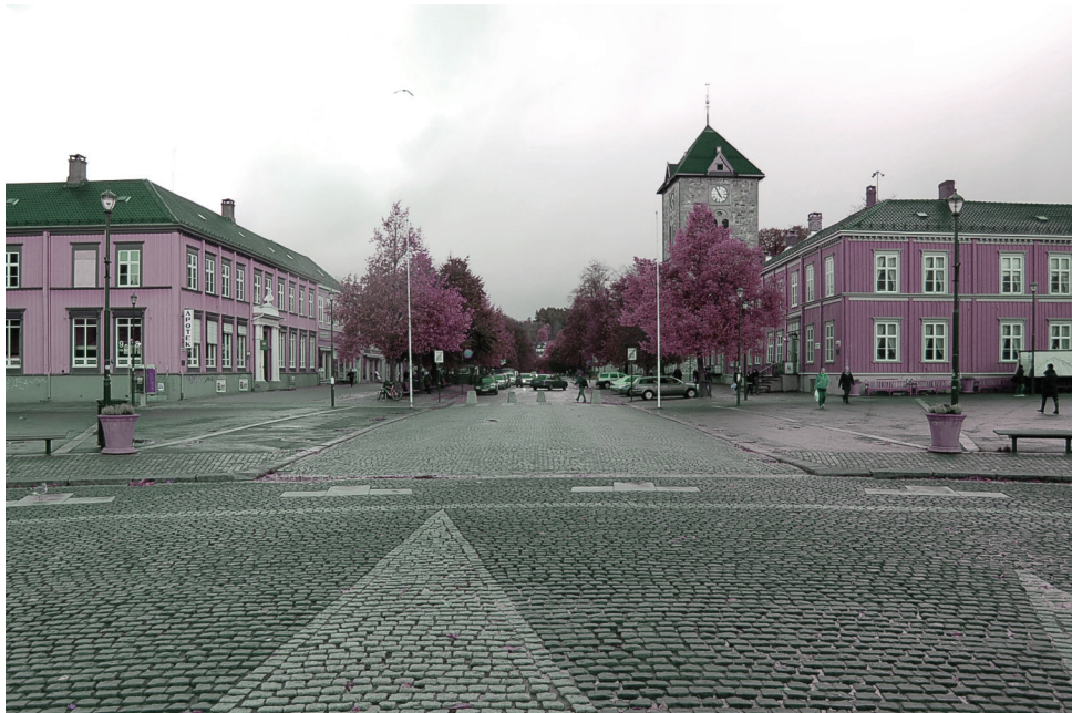
Torvet, Kongens gate | øst