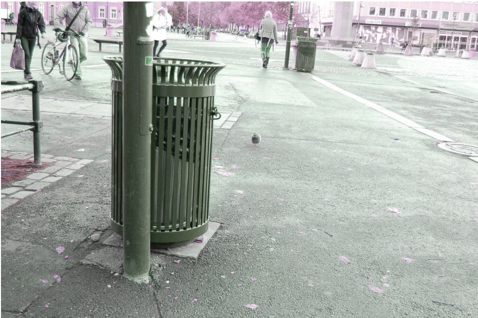
| Lysstolpe og søppelbøtte på torvet