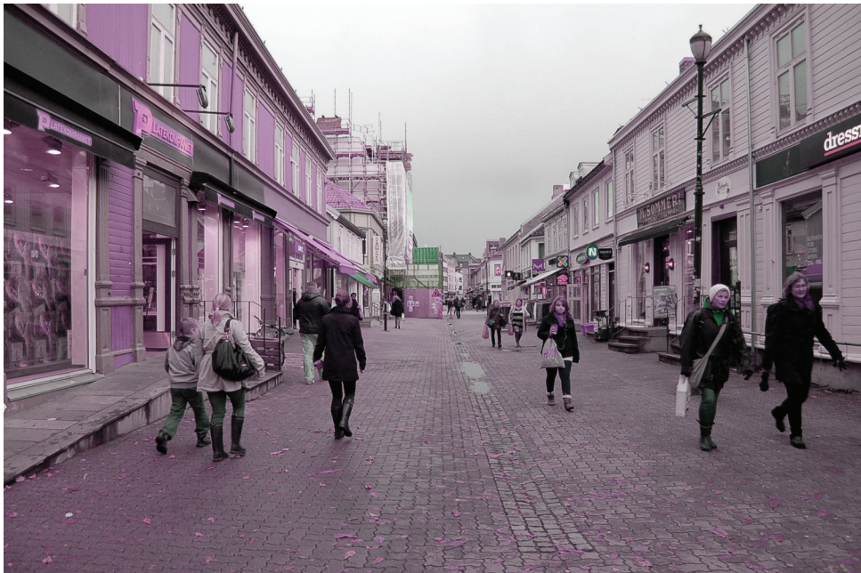
Thomas Angels gate | øst