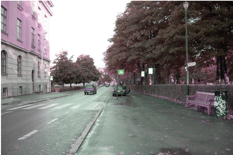
Bispegata | øst