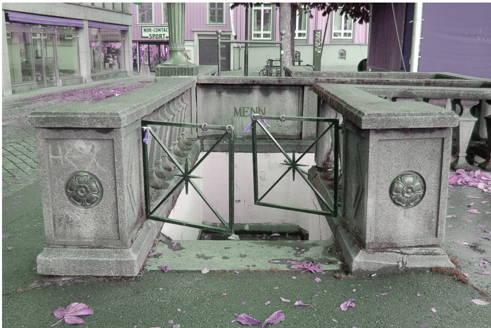
| offentlig toalett på torvet (stengt)