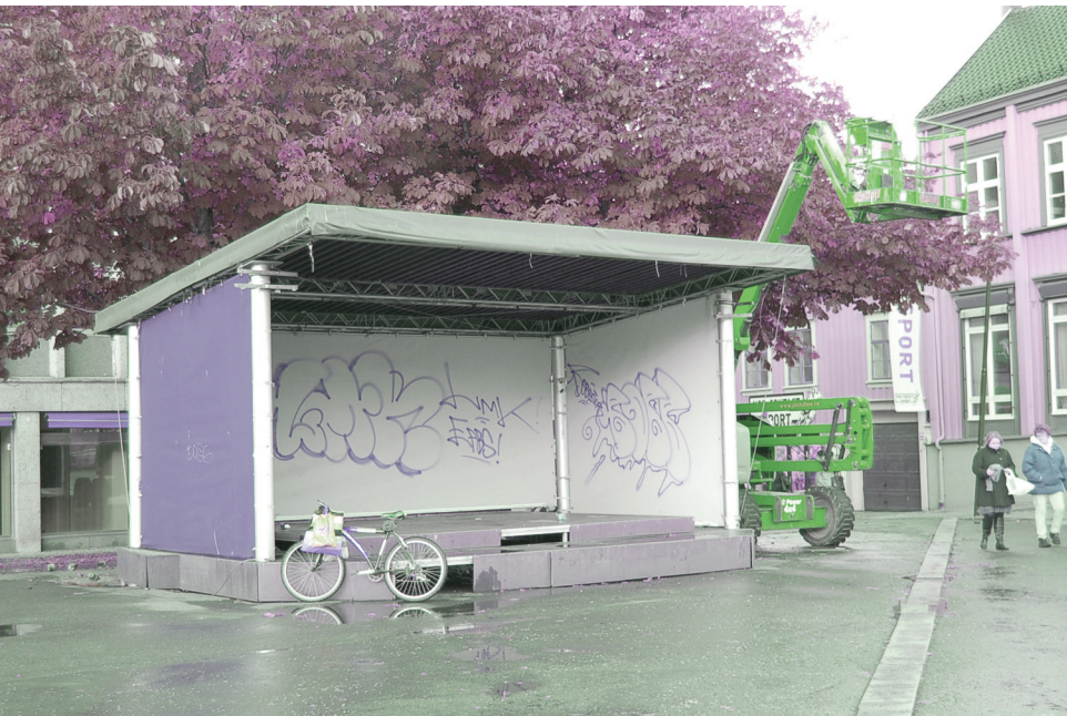
Liten scene på torvet |