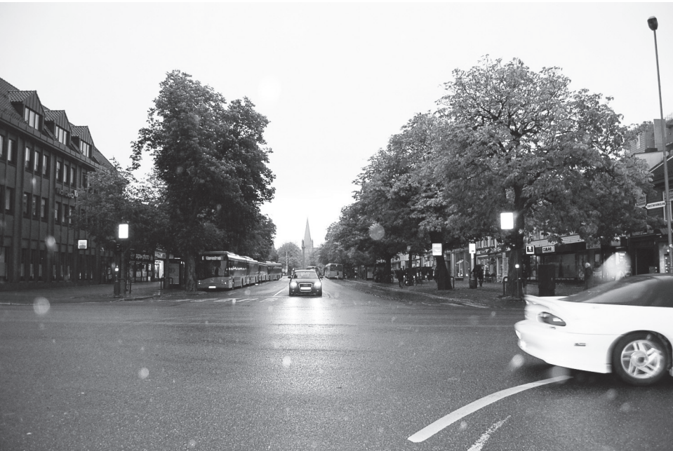
Olav Tryggvasons gate | s ø r