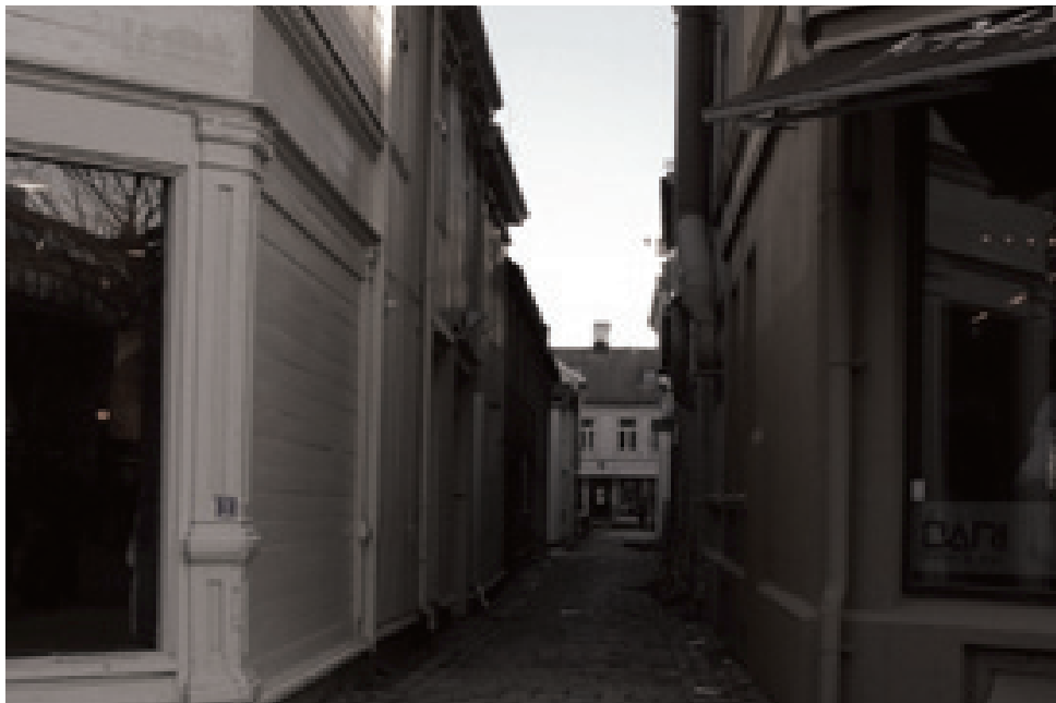
Øvre Enkeltskillingsveita | ø s t