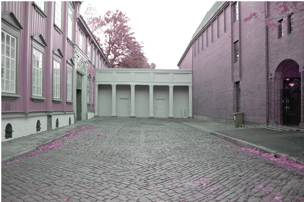
Stiftsgården, parkering | øst