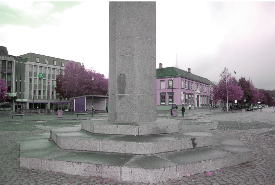
Sokkel på Olav Tryggvasons statue |