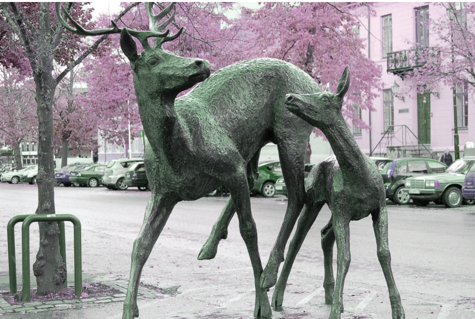
Skulptur på hjørnet av Erling Skakkes gate |