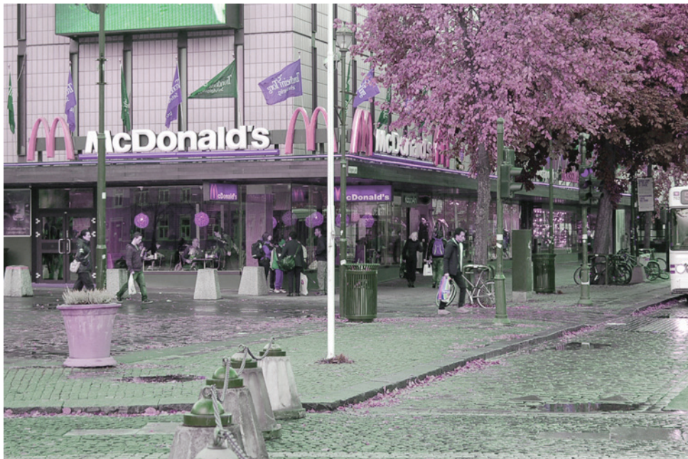
| McDonalds på hjørnet på Trondheim Torg