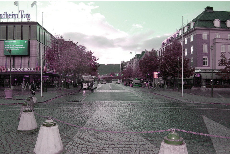
Torvet, Kongens gate | v e s t