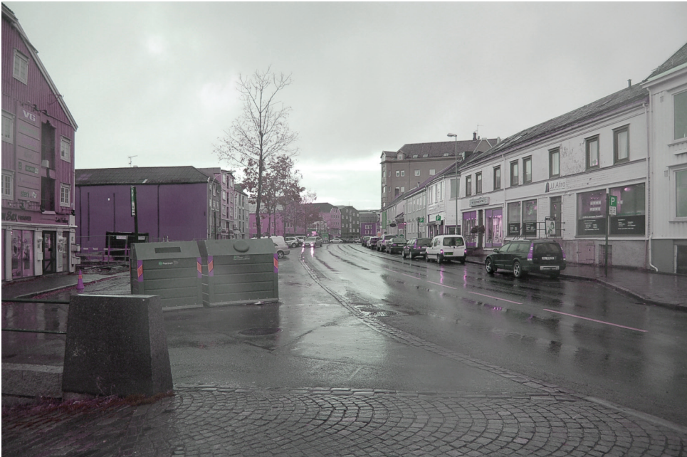
Fjordgata | øst