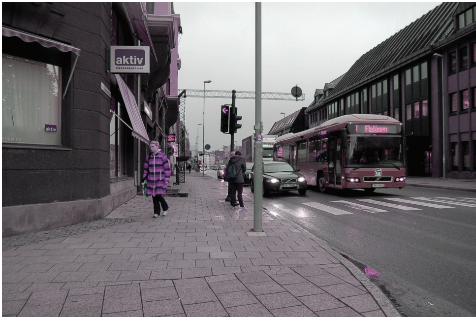
Olav Tryggvasons gate | øst