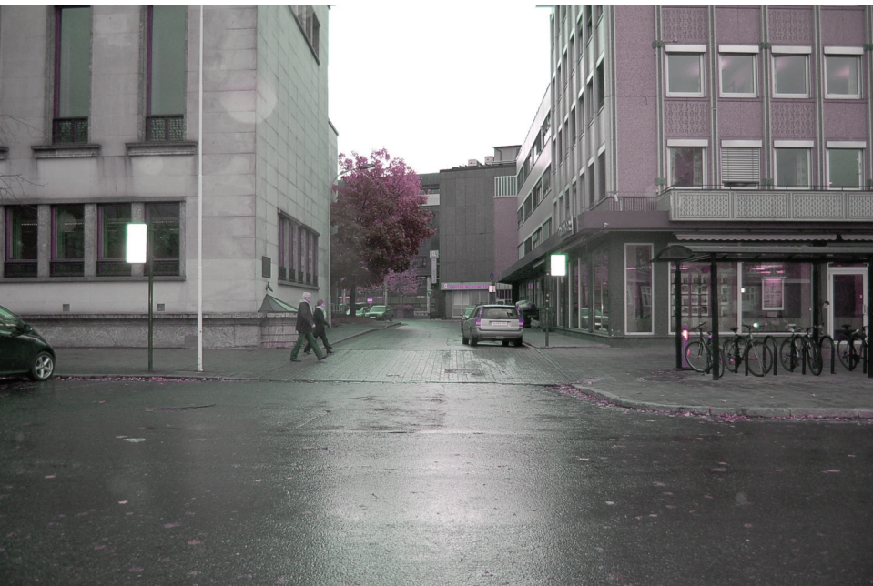
Trondheim Torg parkering | v e s t