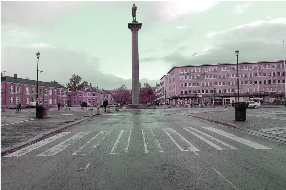
torvet, Kongens gate | s ø r