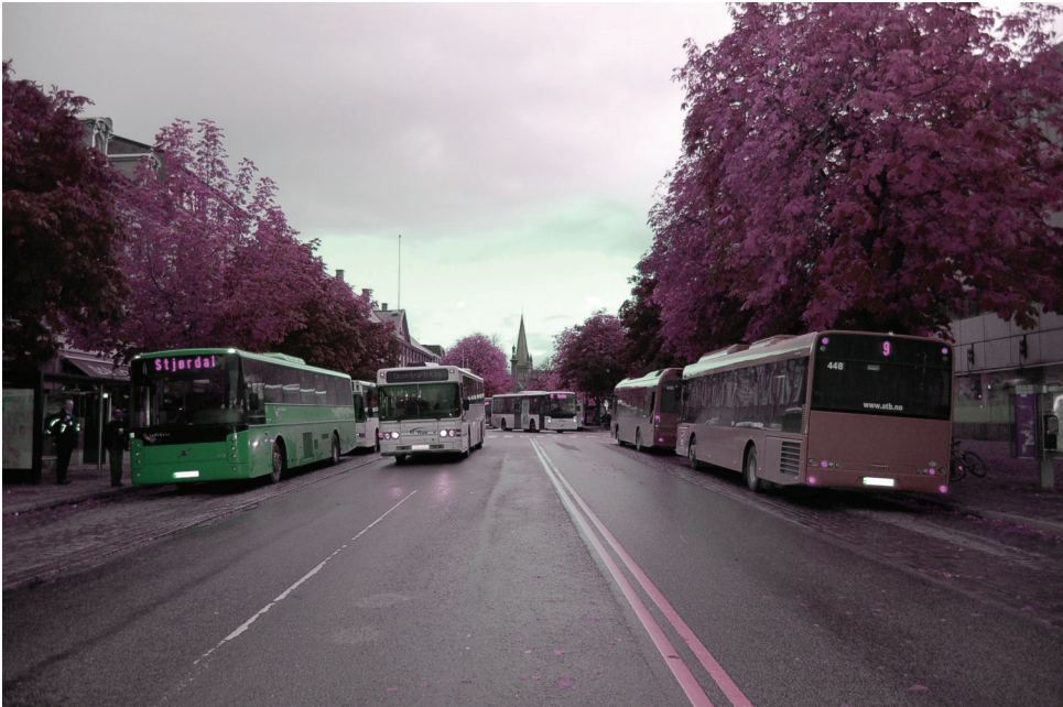
Dronningens gate | sør