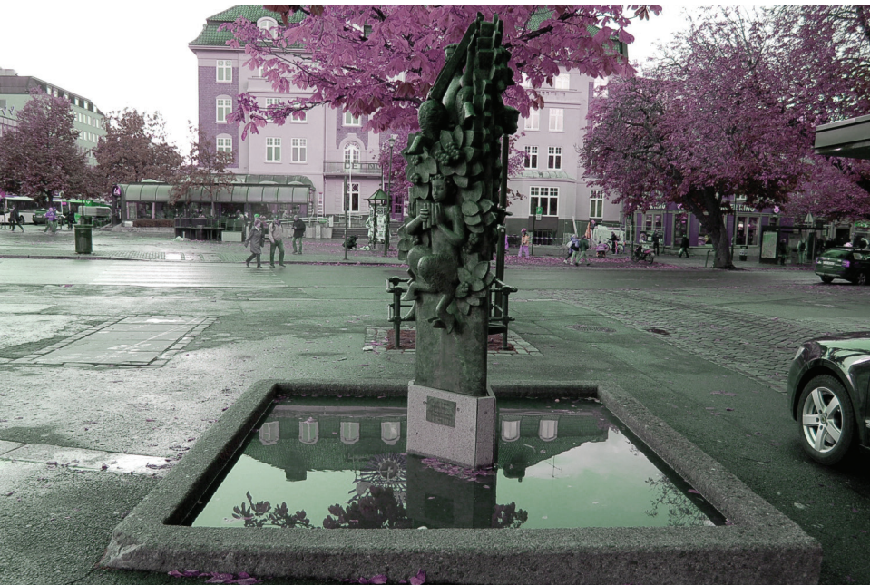
Skulptur(“Watermusic”) på nord-østre kvadrant på torvet |