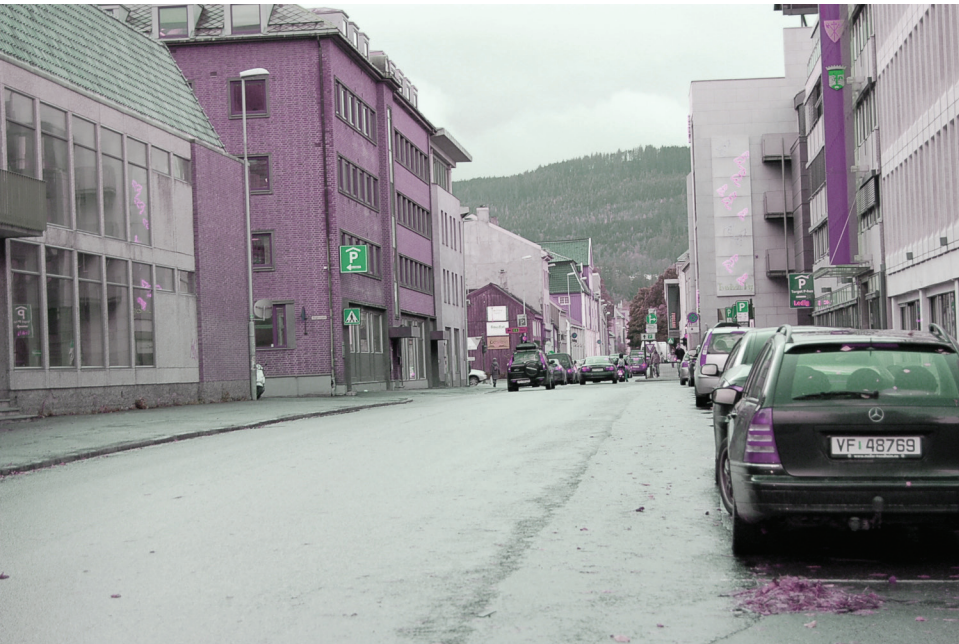
Erling Skakkes gate | vest