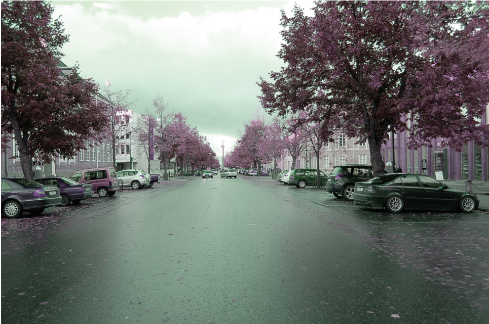
Erling Skakkes gate | nord