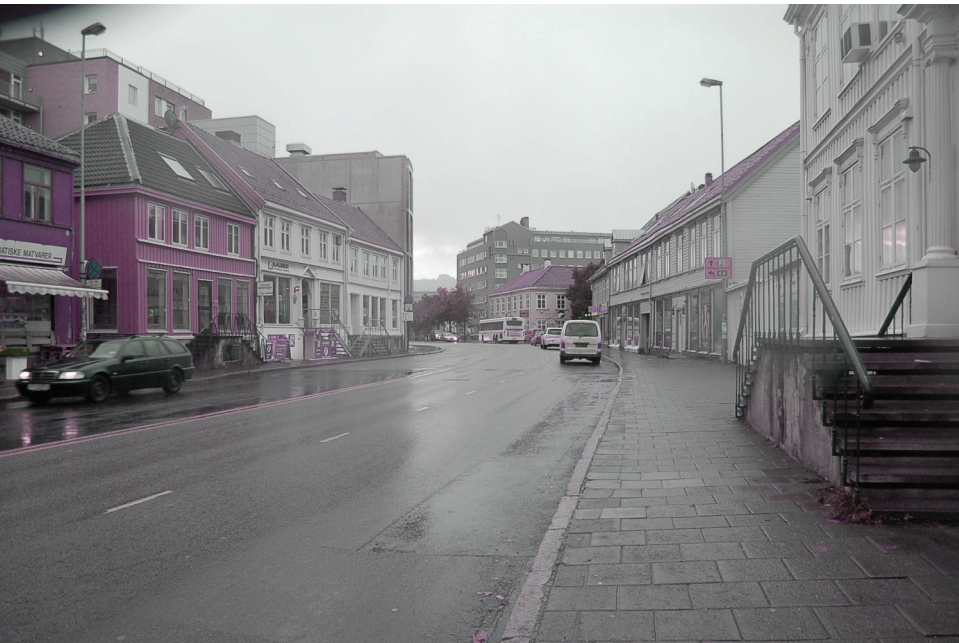
Olav Tryggvasons gate | vest