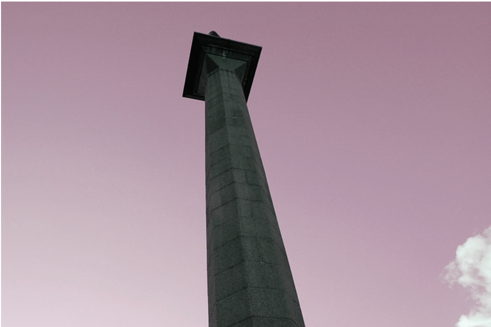
| Olav Trygvasson's statuen