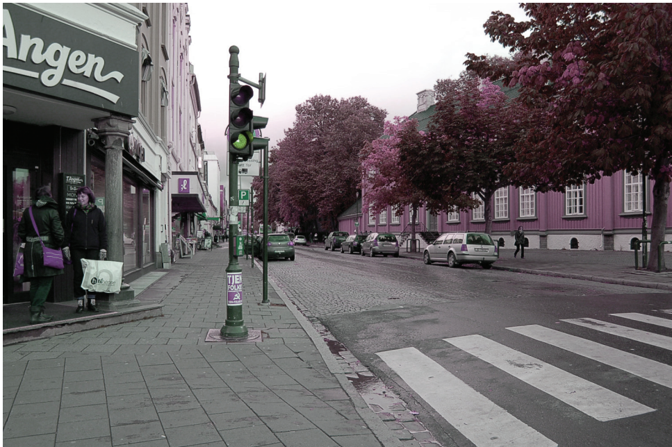
Dronningens gate | øst