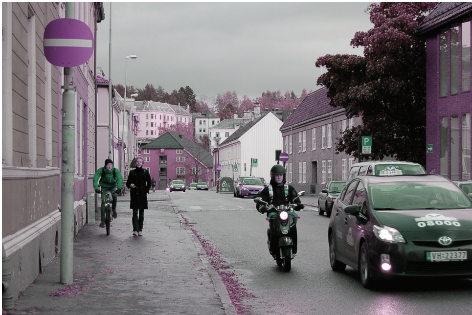
Erling Skakkes gate | øst