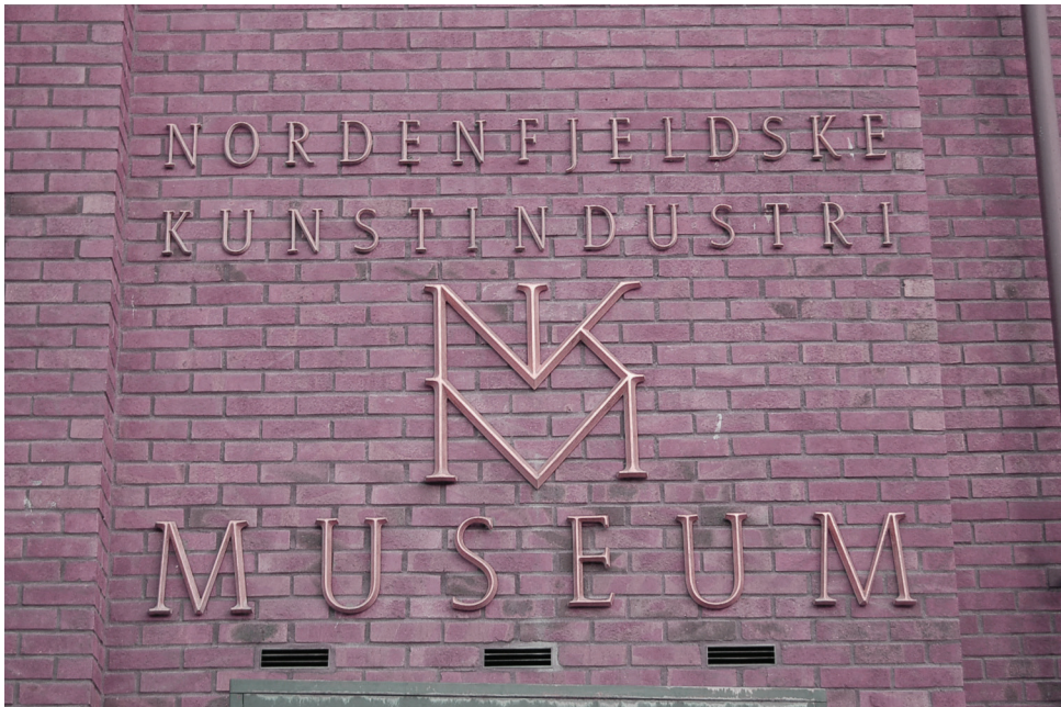
| Fasade Kunstindustri museet