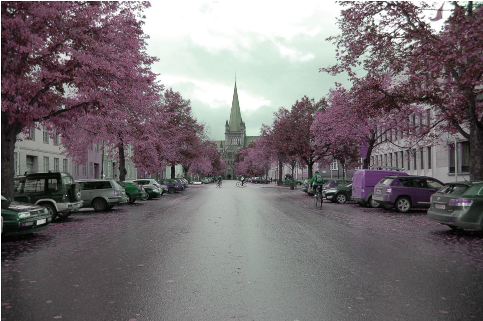
Erling Skakkes gate | s ø r