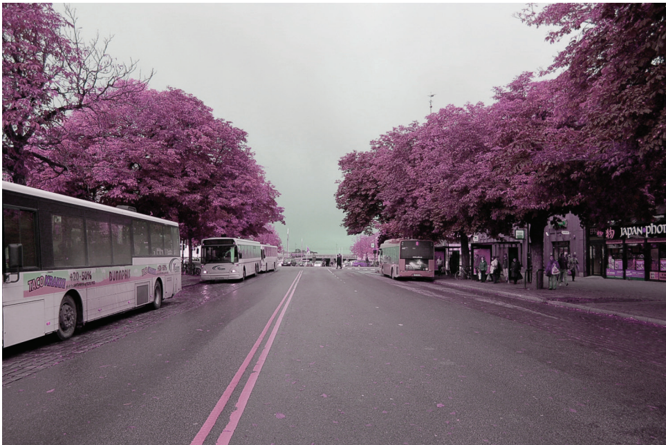
Dronningens gate | nord