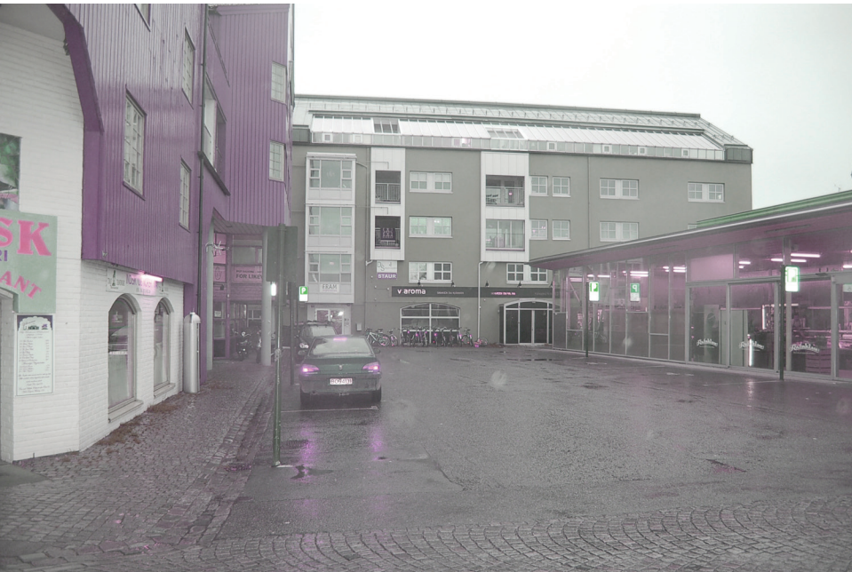
Ravnkloa, parkering | vest