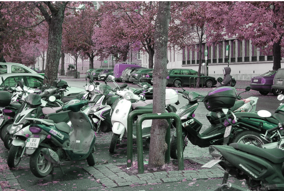
Parkering av mopeder ved Trondheim Torg |