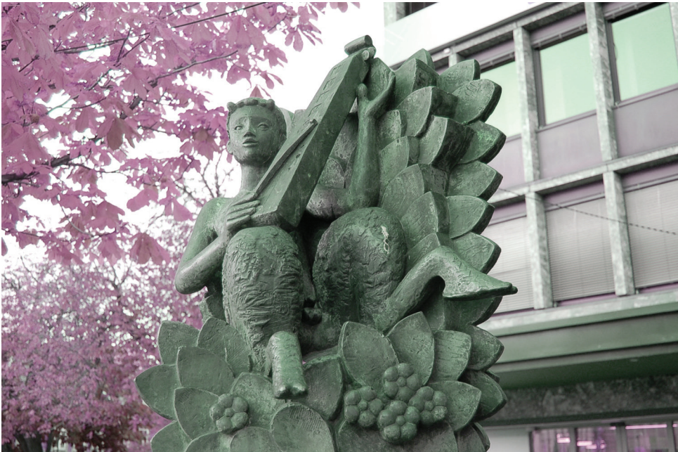
| Skulptur("Watermusic") på nord-østre kvadrant på torvet