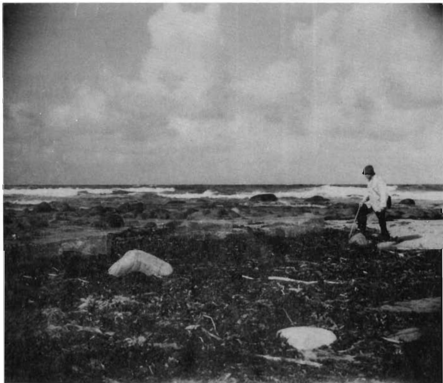
Fig. 3. Schaanning ved fangstruser for vadefugler på Revtangenen 22. september 1946.