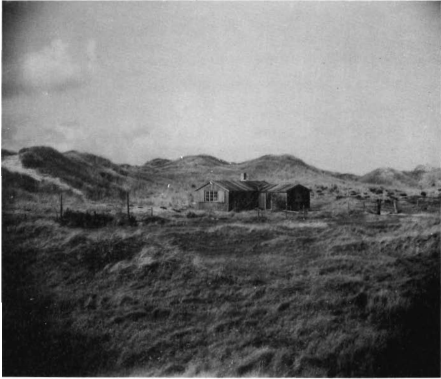
Fig. 2. Ornitologisk stasjon på Revtangenen på sitt opprinnelige sted like innenfor sanddynene. Den er senere flyttet lengre vekk fra strandlinjen, til hovedveien på Reve.